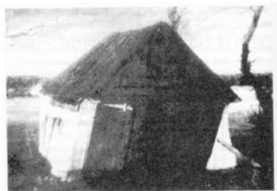
Bagehuset i Terp, vestside