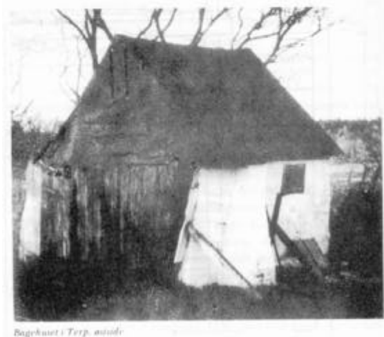
Bagehuset i Terp, østside