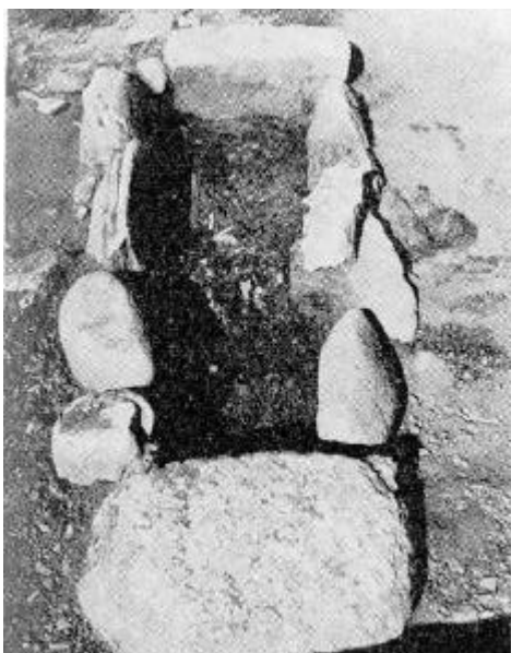
Gærup. Primærgrav, set mod vest.