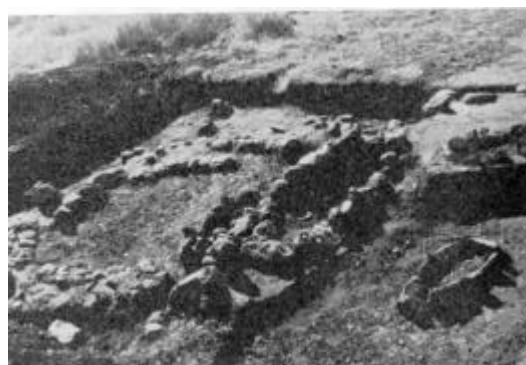
Højen i Sennels, set mod øst, med alle tre grave åbnet.