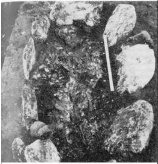
Barnegrav i højen i Sennels, set mod øst.

øst for centrum. Kisten indeholdt desværre kun brændte ben. Grav nr. 3 var en mandslang kalkstenskiste orienteret nogenlunde N-S. Graven var tilsyneladende bygget sammen med randstenskæden. Kisten indeholdt velbevarede dele af en ca. 40-årig mand. Han lå med hovedet i syd. Gravgaverne bestod af et fint bronzesværd med fæsteknap - sværdet var placeret skråt over brystet. Det var tilsyneladende ikke noget nyt sværd han havde fået med sig, da en trediedel af sværdet nemlig odden manglede. Ved højre knæ lå der en fibula og ca. midt på kroppen en dobbelknap. Hele anlægget tilhører ældre bronzealder, ca. 1200 f. kr.