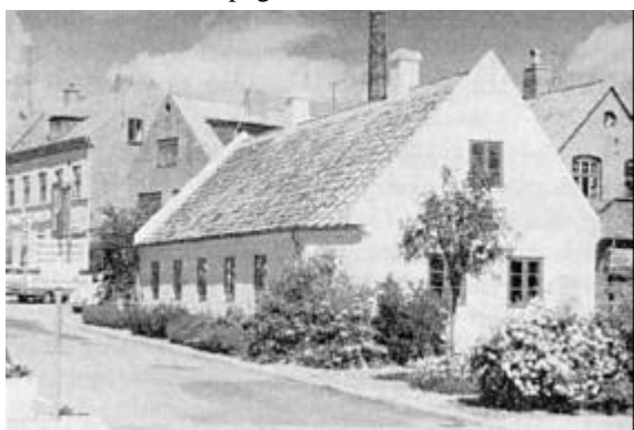
”J. P. Jacobsens hus”, set fra Toldbodgade 1969.

Af skøde- og panteregisteret fremgår, at Chr. Jacobsen på det tidspunkt, da sønnen blev født, 7. april 1847 11 ), ikke ejede andre ejendomme i Thisted, idet den næste ejendom, han købte, de tre grunde ved fjorden, hvorpå han byggede sin store købmandsgård, hvor digteren voksede op, og hvor både han og faderen døde, først blev købt efter sønnens fødsel, nemlig 19. juni 1847, 11. nov. 1847 og 11. dec. 1847 12 ). Det kan da anses for bevist, at J. P. Jacobsen virkelig er født i det lille hus i Skolestræde, som traditionen havde udpeget som hans fødested.