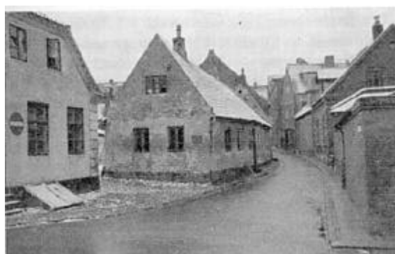
Skolestræde ca. 1940. Til venstre det smukke hus, som af nogle formodedes at være J. P. Jacobsens fødested.

byejendommens og af befolkningens historie, var der håb om, at det ret snart ville lykkes.