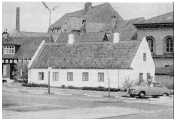
J. P. Jacobsens plads og hans fødested 1969.

Matr. nr. 122c var ligesom 122b fraskilt og bebygget, længe før Chr. Jacobsen købte 122a. Grunden har nu matr. nr. 257, tidligere nr. 80.