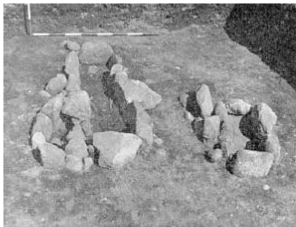
De to grave fra "Dalgaard" i Fårup, tv. graven med tilbygningen, th. barnegraven. Man ser lerkarret og rester af skelet.