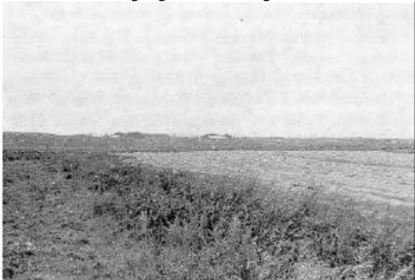
Viser Kultur-Engstø paa skaar i Sdr. Hovgaard's Eng paa Ejerslev-Siden af Støen. Og bagved er Damsgaard's ogsaa ret store Eng, hvor Naturgræs stadig bruges til Stuefedning. Og længere mod Nord er der kultiverede Støenge tilhørende "Vestergaard" og "Roseneng" i Ejerlse. De to Gaarde paa Sejerslev-Siden af Midtstrømsaaen er ogsaa Stø-Gaarde.

kunde tænke sig, og han havde ingen Part i Hundstø. - De gamle Gaarde i Byen blev ikke bygget op før omkring første Verdenskrig, og det var særlig Stuehusene.