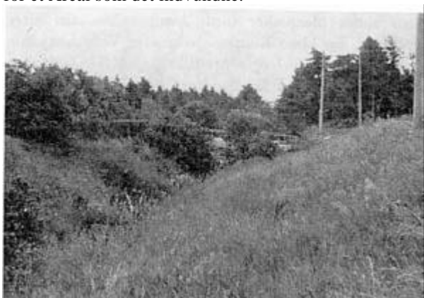
Viser den østlige Kanalbro der fører ind paa "Ejerslev Lyng" som Kommunevej fra Ejerslev Vig til Øster Hunnerup og videre til Sdr. Draaby.

Naar Foretagendet er færdigt vil Udførelsen heraf have kostet henved 17.000 Rd., hvad der maa anses for billigt for et Areal som det indvundne.