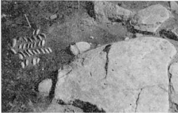
"Sildebensmåtte" ved indgangen til et hus

dog også en type mindre huse. De er næsten kvadratiske. I disse er der beboelse, men ikke stald. Det, man finder, er først og fremmest gulvet, der er lerstampet, og spor efter de tagbærende stolper. Sådanne stolpehuller fremtræder som mørkere områder i leret. Væggene i jernalderhusene i Thy har været af græstørv og jord. Det kan nogle steder ses på jordens farve, hvor væggene har været. Mellem husene er der mange steder brolagte gader. Både hustomterne og gaderne findes i flere lag under hinanden, da jernalderens folk boede på samme sted gennem mange generationer. I Vestervig er et af husene således blevet bygget op 7 gange i løbet af 3-400 år.