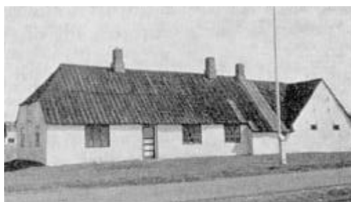
Thøger Iversens hus set fra syd Det oprindelige ses mellem døren og flagstangen

Fiskerne gik til Vilsund (25-30 km) efter sildinger til agn.