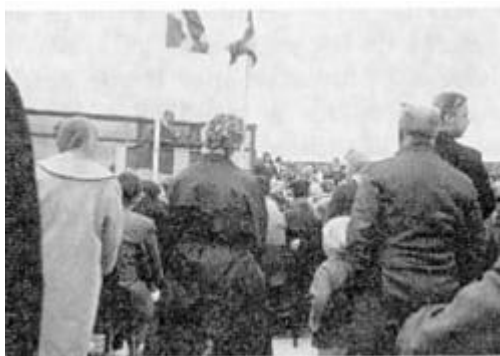
Fra Lyngbys 100-års jubilæum 15. august 1964

Lyngby er afholdt af mange mennesker, som af hjertet vil ønske byen en lys og lykkelig fremtid.