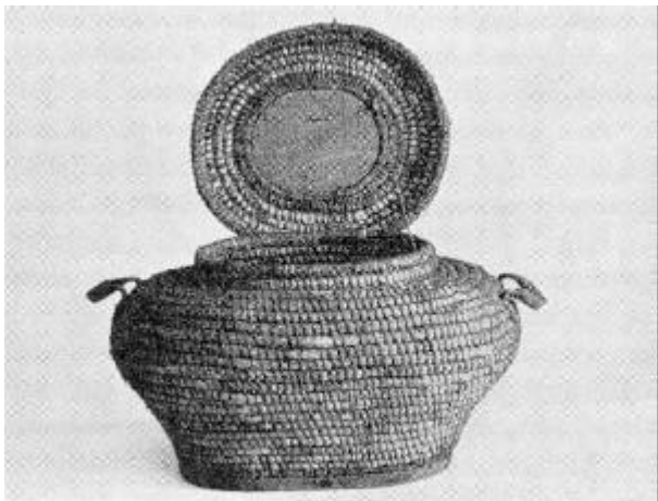
Ovel løb fra Silstrup