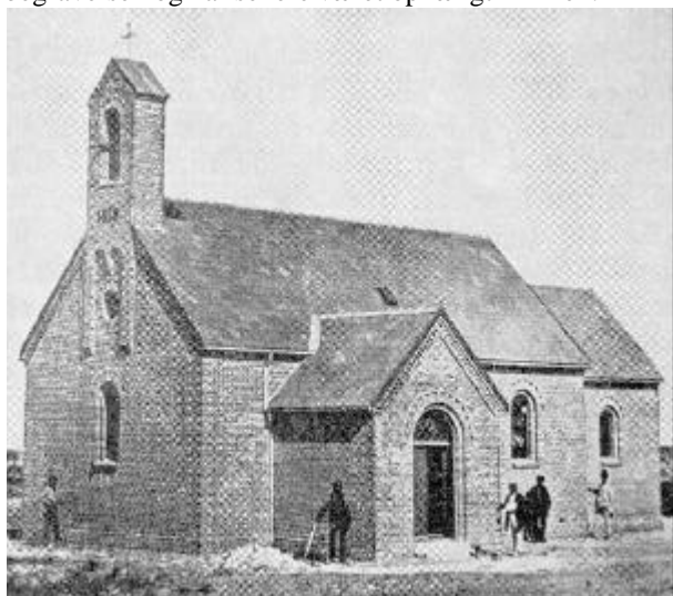
Vorupør gamle kirke.