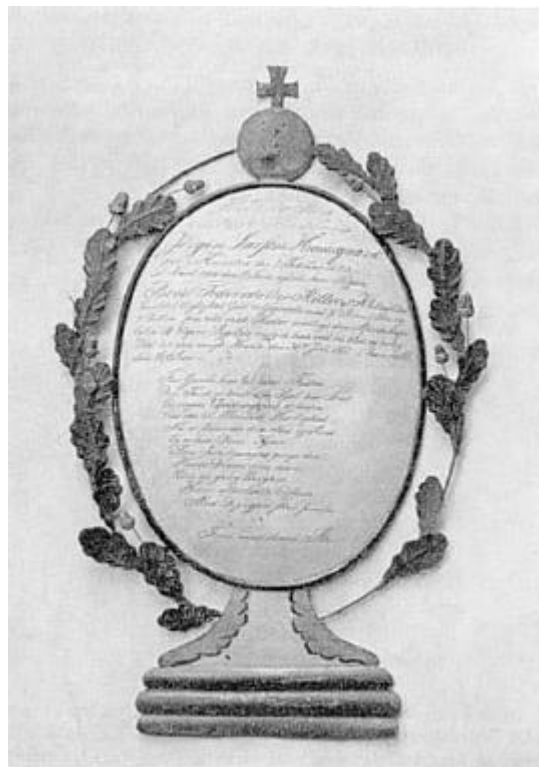
Mindeplade 11 1857. Findes i Nationalmuseet (Dansk Folkemuseum).