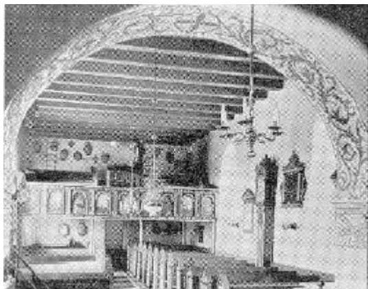
Vester Vandet kirke med det gamle ur

Tale holdt ved kirkefesten i Vester Vandet kirke den 20. juni 1954.