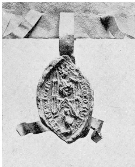
Vestervig Klosters Provstesegl.