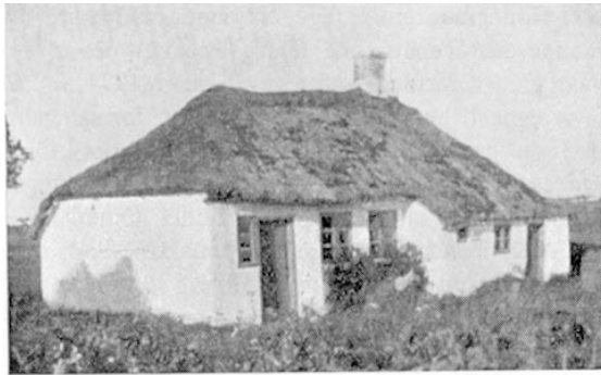
Huset set fra Nordøst

(Historisk Årbog for Thisted amt 1933, side 412-413)