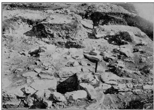
Hellig Kilde Brønden i Kapellets Sydмур og Alteret ved Østmuren.