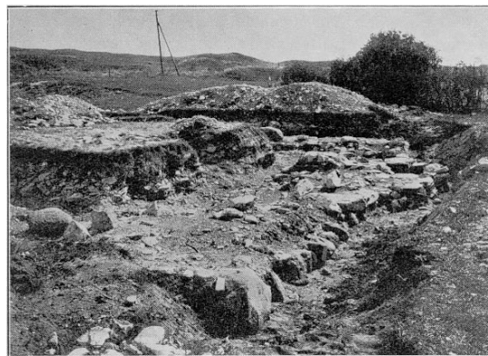
Hellig Kilde Kapellets Sydмур set fra Vest. Midt paa i Firgrunden ses den store vestlige Hjørnen og Sokkelstenen.

Jeg finder nu i Tabellis Ecelesiasticis, at een af min ærværdige Sal. Formænd har skrevet, at Rheer Kircke, som er bygget i et Kors, skal være kaldet Hellig Korses Kircke, Handsted Kircke, Handske Kircke og Wixøe Kircke: St. Peders Capell, som i gamle Dage skal være forfløttet fra en Gaard i Bierre i Rheer Sogn, som kaldes Capell. Ved samme Gaard findes endnu de 4 Hjørne Steene og mange bundne Muursteen og Kalck, som har været i Capellis Bygning. Nord ved Capelle har været en Hellig Kilde, som steden endnu kand udviise."