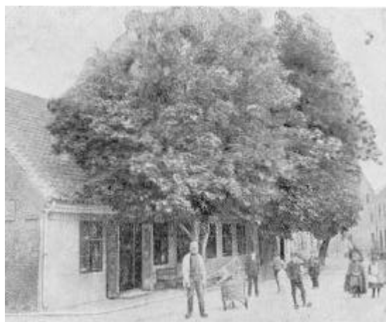
Gammel Købmandsgård (Lille Torv Nr. 3)

Den 10. Januar 1821 blev det Areal, hvor Thisted Plantage nu ligger, købt for at der kunde anlægges en Planteskole, hvorfra Klitplantagerne kunde blive forsynede med Planter; senere udvidedes Arealet med et tilgrænsende Stykke 3 ). Imidlertid mislykkedes Klitplantningen; men Planteskolen fik dog stor Betydning, idet Amtets Beboere gratis dels fik Træplanter og dels Frugttræer til deres Haver. Efterhånden forvandlede Planteskolen fuldstændig Karakter og blev et Slags Skov anlæg, der var til stor Glæde for Byens Borgere og Omegnens Beboere og "til Ziir for Thisted Bye"; men da Hensigten med det oprindelige Anlæg på den Måde svandt, og Betydningen af det kun blev den indirekte at have fremmet Lysten til Plantning i Landsdelen, fik Thisted Købstad i Skrivelse fra Rentekammeret 29/9 41 4 ) Tilbud om, hvis den ønskede det, da at måtte antage Plantagen som Ejendom på nærmere angivne Betingelser, nemlig dels at udrede Lønninger og dels