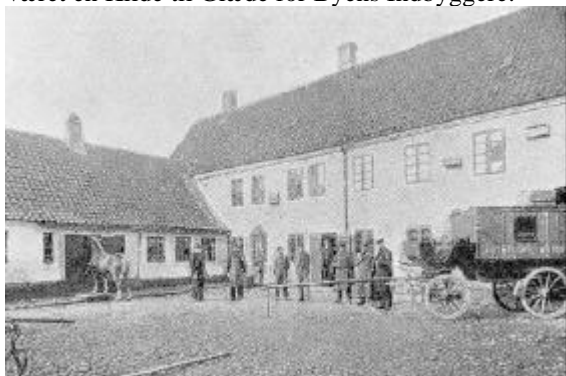
Gammel Købmandsgård (Østergade Nr. 8)