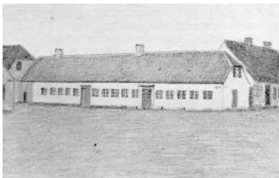
Kiils-Gård, Storegade Nr. 2

Også Håndværket tog et betydeligt Opsving og ikke mindst kom Skibsbyggeriet til at spille en Rolle, og Thisted Håndværkerne blev bekendt for deres gode Arbejde på alle Områder.