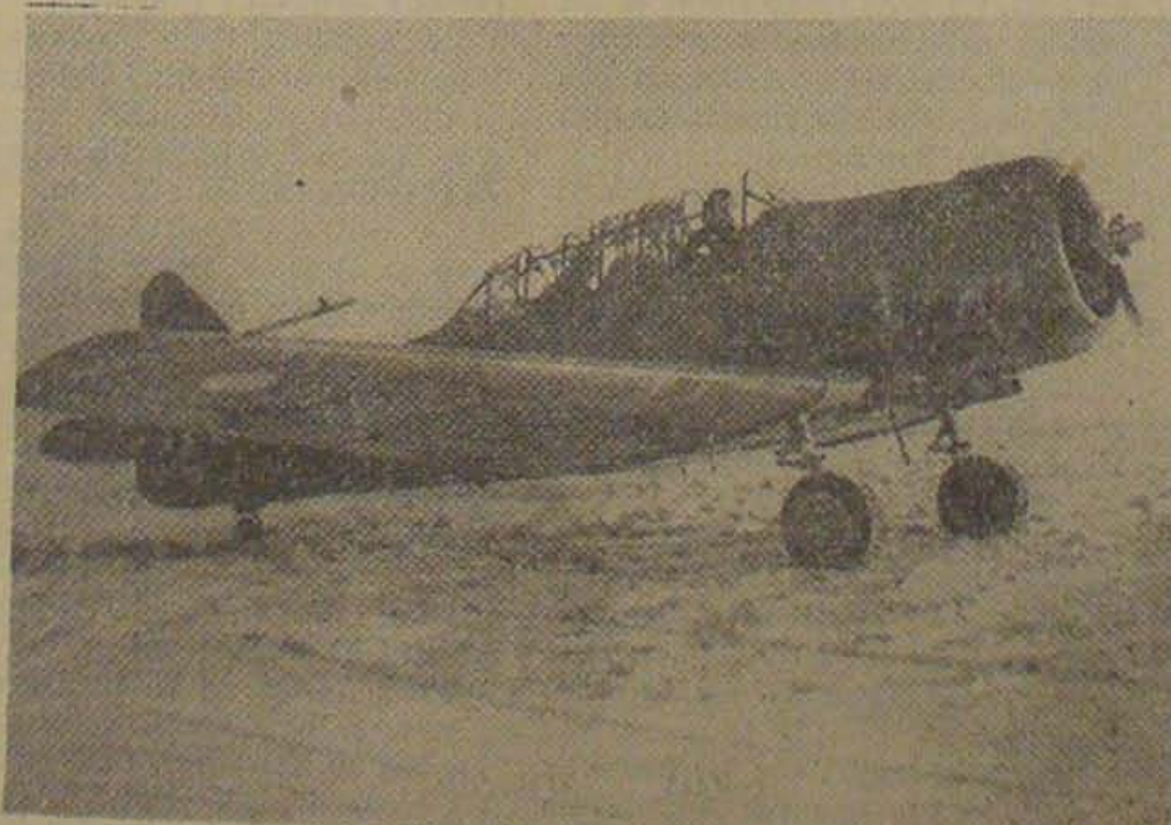
Harward-Maskinen, en kombineret Jager- og Bombemaskine med Plads til to Mand, lette Geværer og to mindre Bomber.

Halvandet Aar skulde der altsaa gaa, inden der for Alvor kom Gang