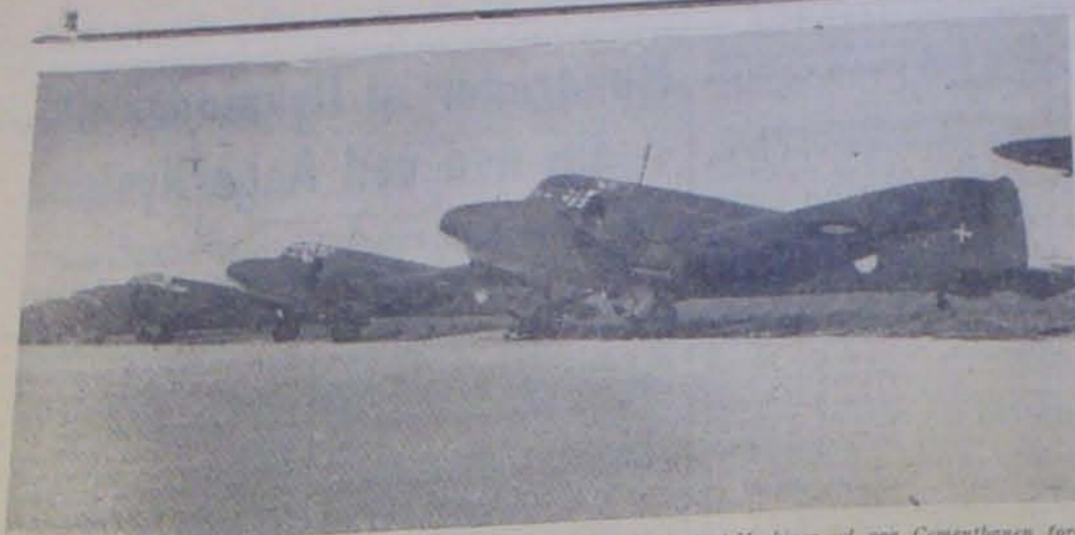
Hver Formiddag, naar Motorerne prøvkedes, ruller de to-motorsede Oxford-Maskiner ud paa Cementbanen foran Værktøjsbygningen. Der flyves ikke med disse Maskiner endnu, indtil Eleverne først skal være færdige med Harvard-Uddannelsen.