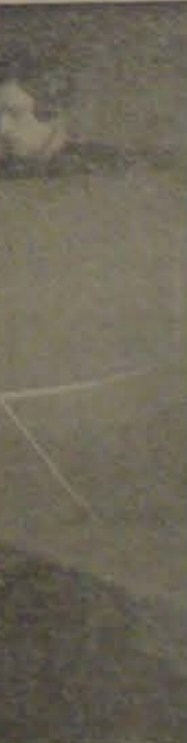
En af Eleverne har taget Plads i Landingskøret, og der flyves Instrument- og Blindflyvning.

vigtigste Led i turigvis den næste og indfaset, inden de til at tage i Cockpit.