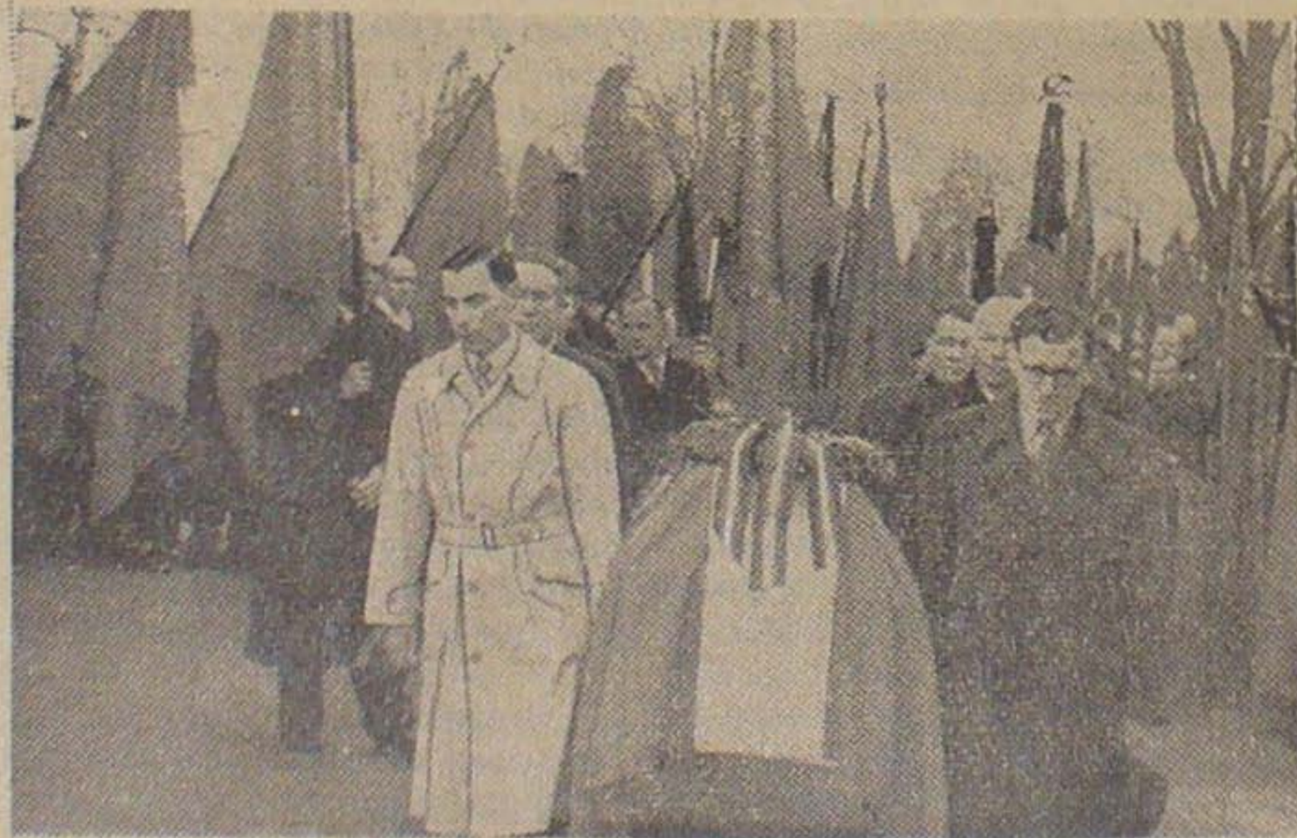
Fra Højtideligheden paa Bispebjerg Kirkegaard. Her bærer tidligere Kam- merater Kisterne til Kapellet.

Erhvervs- og Færdselsministeriet i Kiel henstiller til Virksomhederne in- denfor Sydslesvigs og Holstens Er- hvervsliv, at de giver deres Personale en lang Juleferie for derved at opnaa