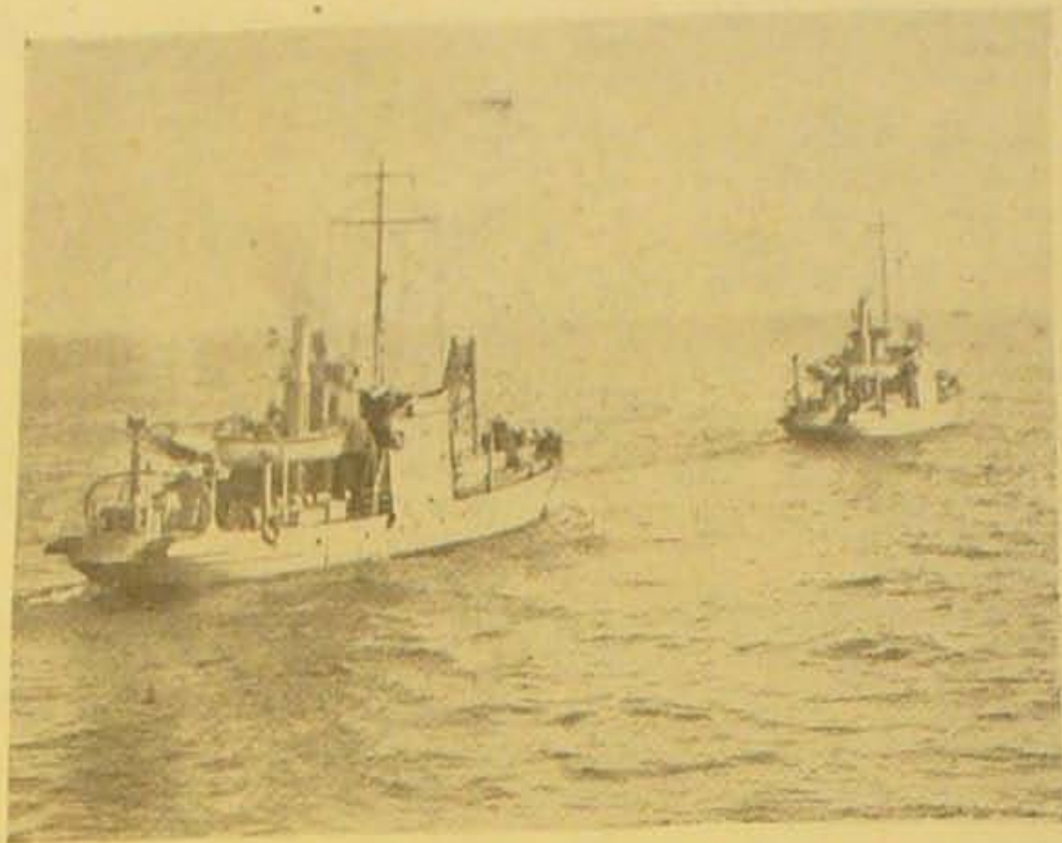
Ministrygerne staar ud fra Hirtshals.

Der er udlagt Lystønder til Orientering for Fiskerne.