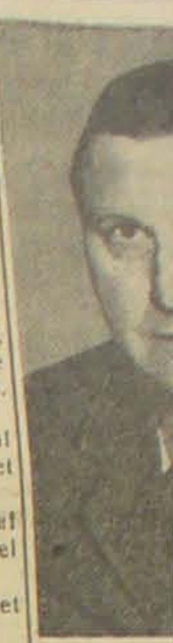
Luftmarsk... er ankomme... Posten som... kers Chef e...