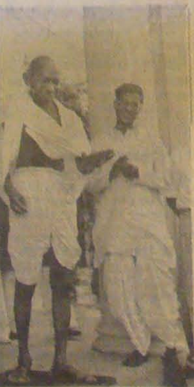
og fotografet i Vicekongens Palads i Indias sidste Besøg.

Realskolen den 1. April 1944. Han var da kun 16 Aar gi. Det var derefter Meningen, at han skulde have været paa et Musikkonserveratorium i Sydtyskland, idet hans Studier der vilde blive betalt af den tyske Stat. At han kunde komme der skyldtes Familiens Forbindelser i Tyskland. Konserveratoriet blev imidlertid opløst, og da han trængte til Penge, meldte han sig som Tolk hos Tyskerne. Det skyldtes dels hans Fader, at han fik denne Plads og dels havde han mødt en tysk Underofficer fra hans Moders Hjemegn, som ogsaa havde talt om Pladsen. Han underskrev en almindelig Lønkontrakt paa Kommandanturen, men ikke en Formular, han fik forelagt og hvorefter han skulde indberette til Tyskerne om Sabotage m. v., men han fik ikke udleveret Vzaaben.