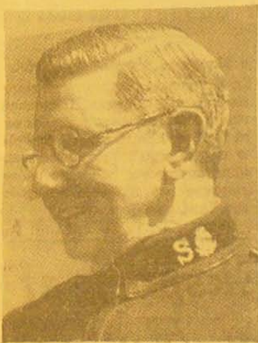
Albert Orsborn, den nye Verdenschef for Frelsens Hær.