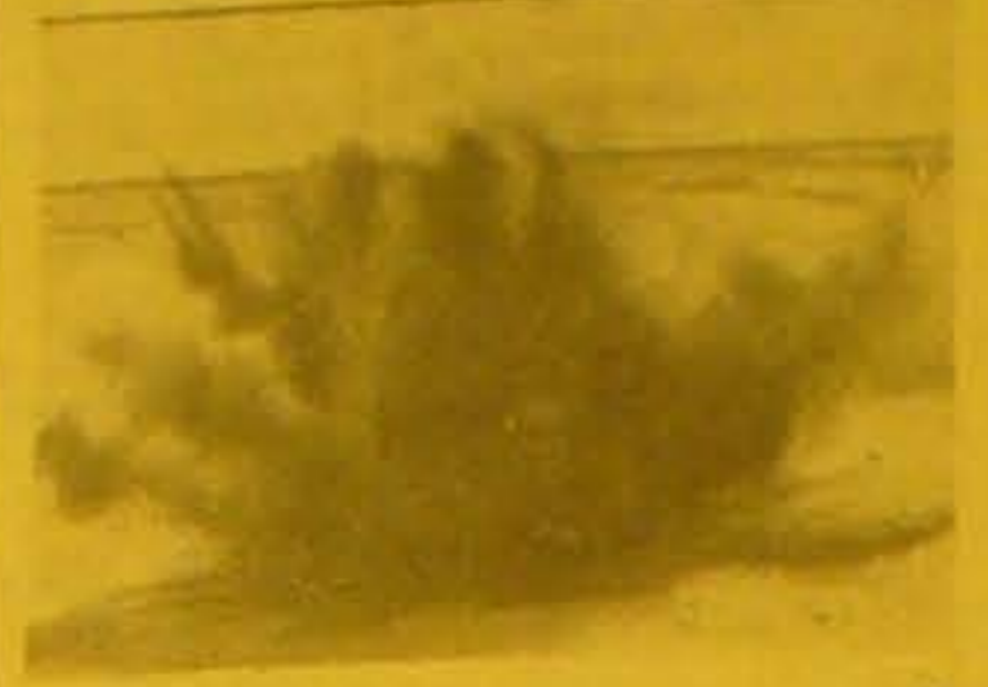
Under Efterkontrollen er man altid paa Miner, som det blev nødvendigt at sprænge paa Stedet.

En særlig Minetype er de saa- kaldte Alarmeringsminer, der an- tendes ved Hjælp af en Snubletraad. De fandtes næsten hele Vejen langs Vestkysten, men de var ikke saa far- lige, fordi de hurtigt blev ødelagt af Fugt. En anden Form for Alarme- ringsminer er de Skræmmeladninger,