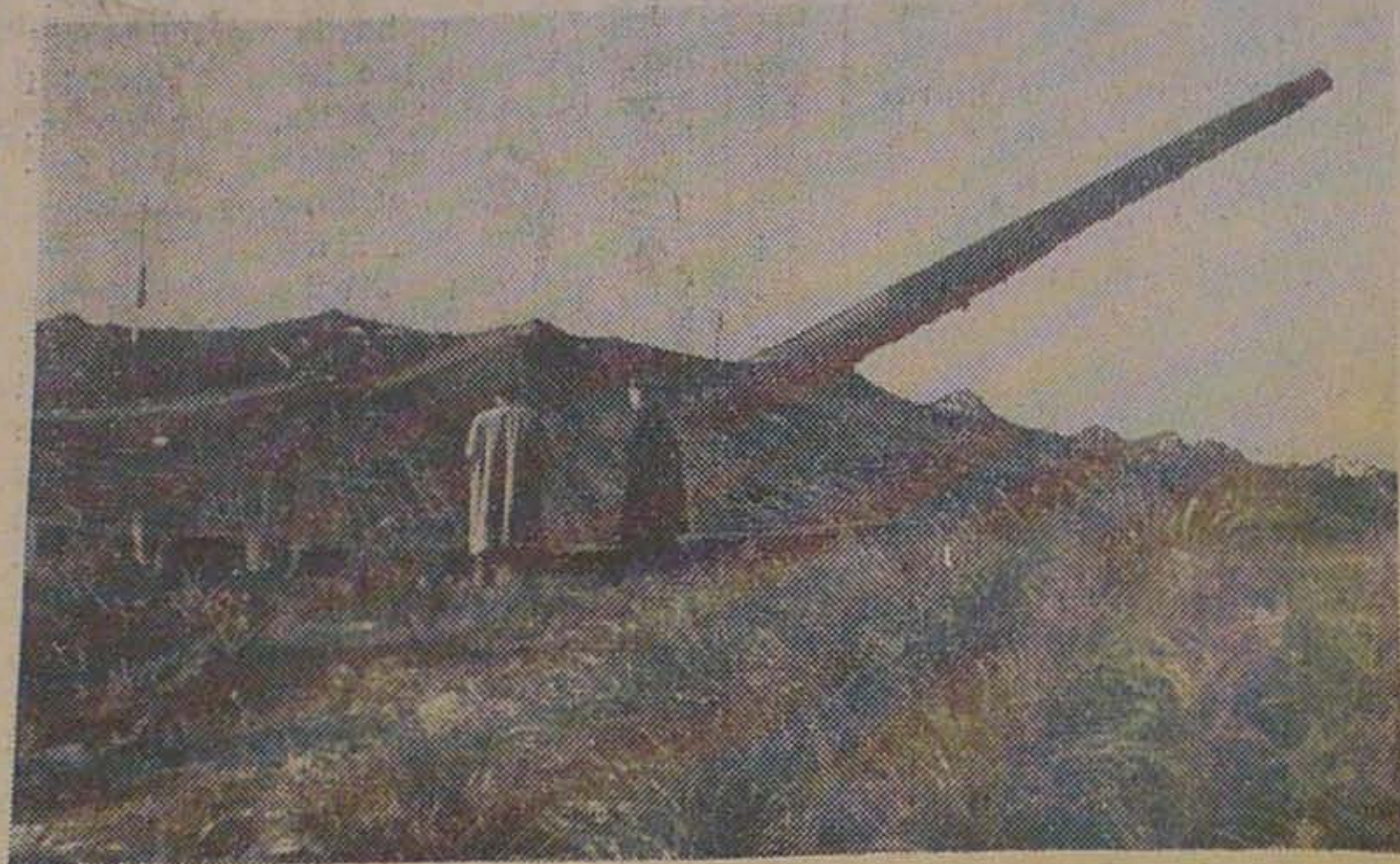
Fæstningskanon, Kaliber 38 cm fra det tyske Kæmpebatteri ved Hansted. Den kunde skyde Halvvejen til Norge.

Jylland var et af den tyske Vestvolds stærkeste Led.