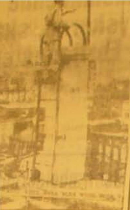
Det amerikanske Flag hejst i Tokio. (Hilberts Telegram).