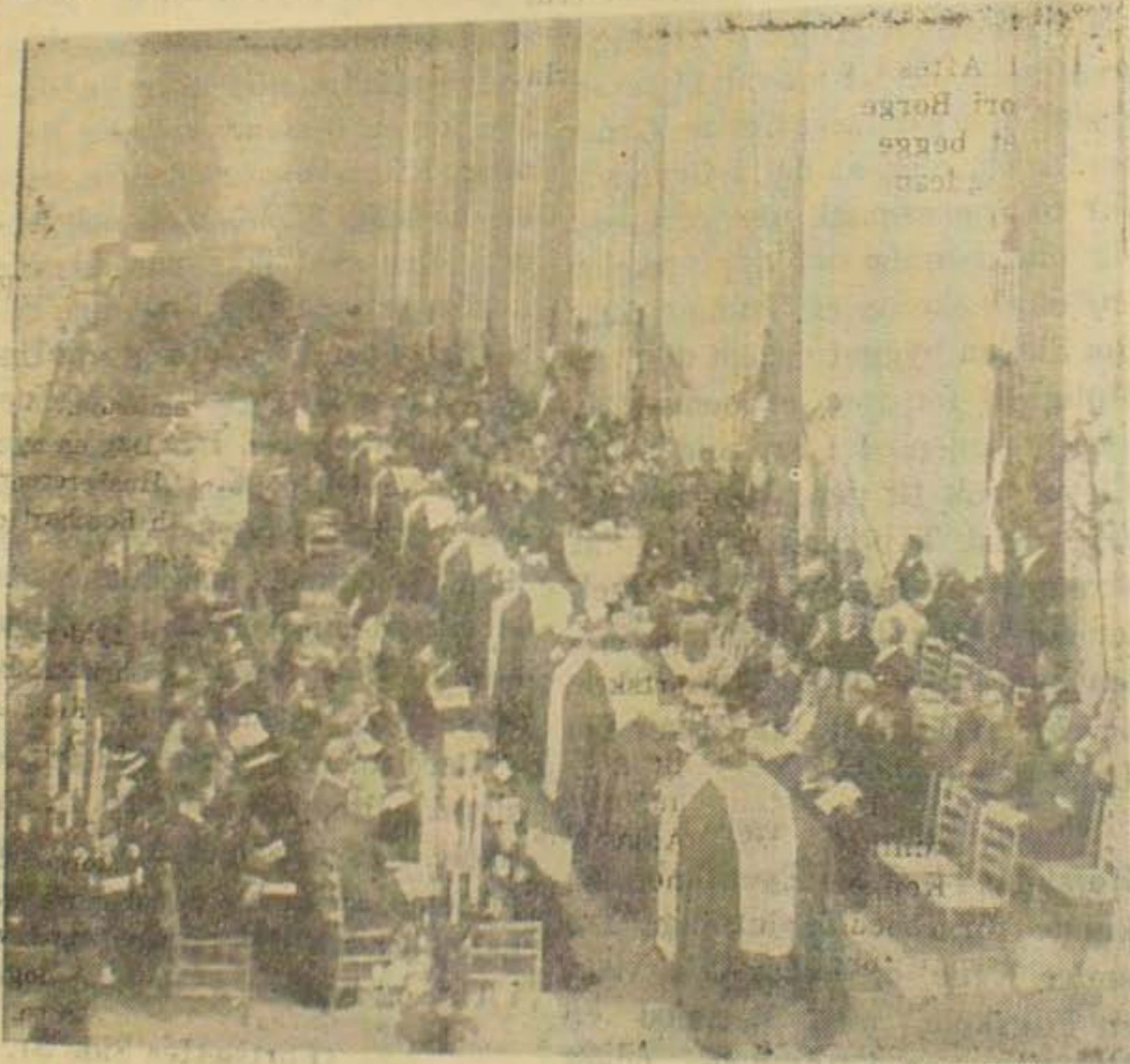
Ved en smuk Højtidelighed i Grundtvigskirken er Heltene fra Hvidsten Kro blevet bisat. Vi bringer et Billede fra Højtideligheden.