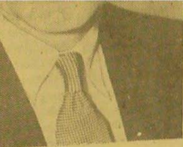
James V. Forrestal de Staters Marineminister.