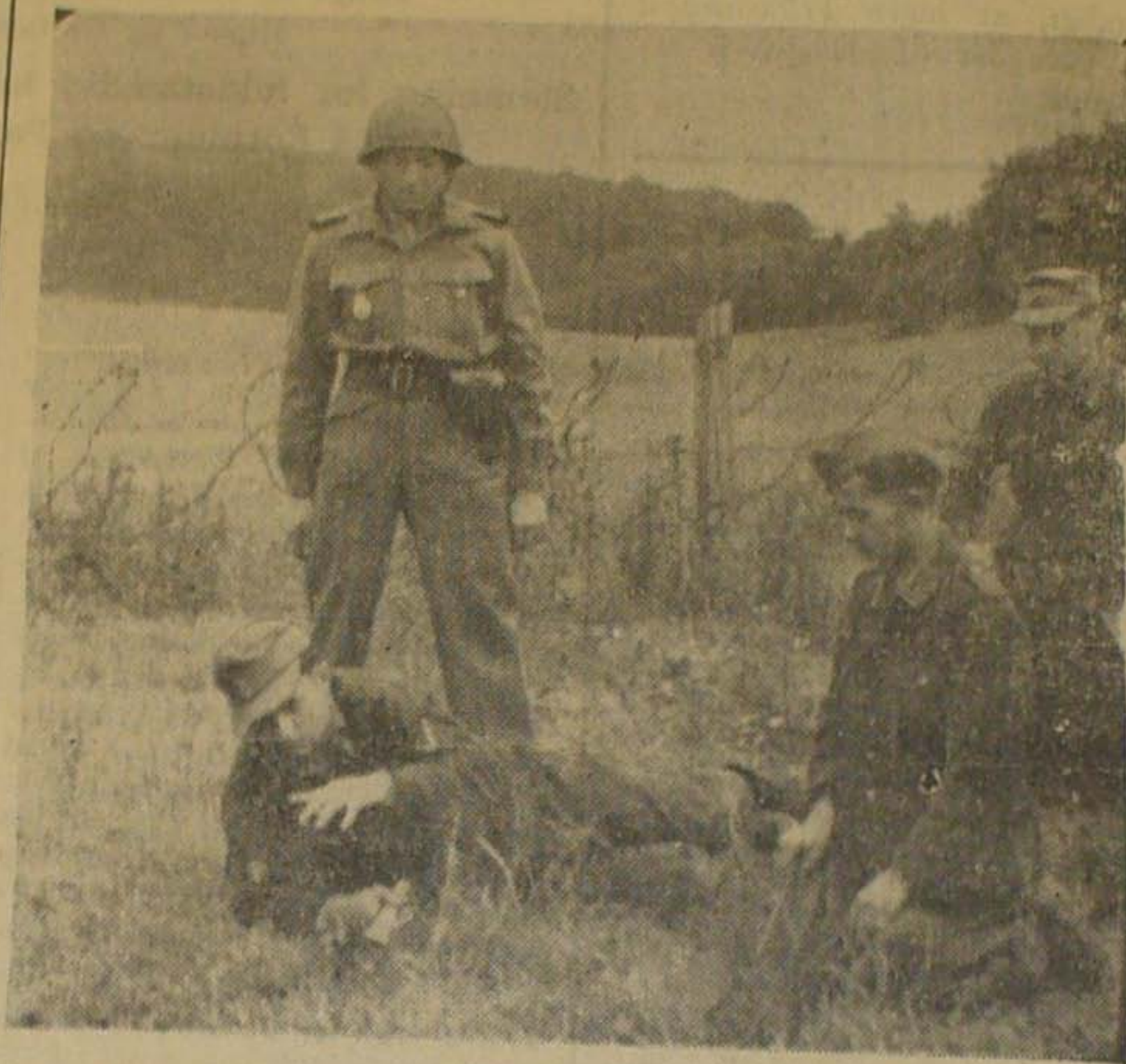
Henved 2 Mill. Landminer, som Tyskerne har velsignet Danmark med, skål fjernes hurtigt. Tyskerne maa selv udføre dette farlige Arbejde. Det kontroleres efter engelsk Ønske af „Danforce“ Brigaden, der i Sverige har faaet speciel Uddannelse i Landminerydning. Foroven ses en „Danforce“-Mand, der kontrollerer tyske Pionerer under Udgravning af Miner med en Træske.