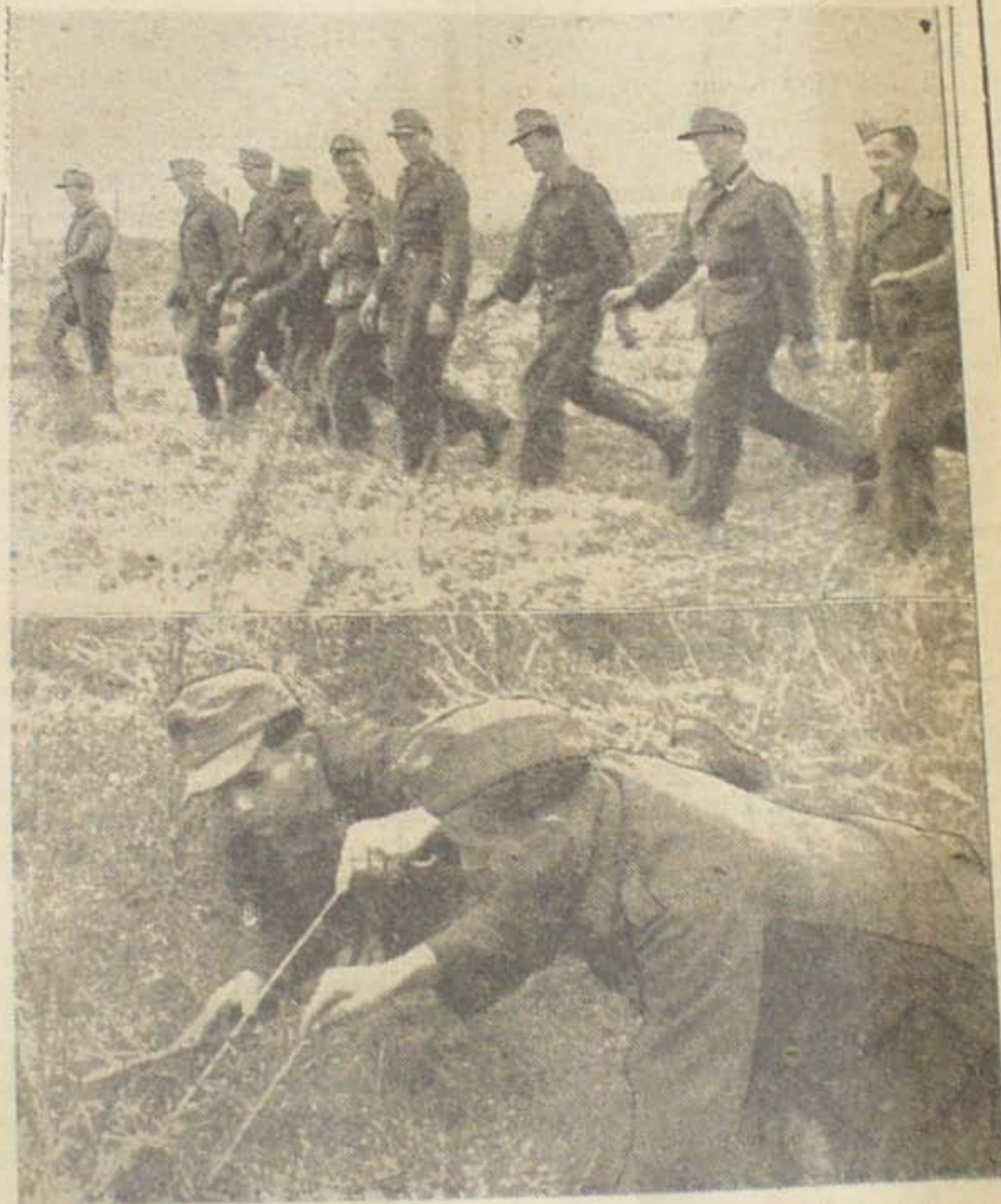
Nederst tyske Pionersoldater, der prikker i Jorden i et Minefelt for at finde Landminerne. Øverst et Hold marcherer over et Minefelt for at godtgøre, at dette er tilfredsstillende rensat.

Tilliden til ham smuldrede langsomt bort.