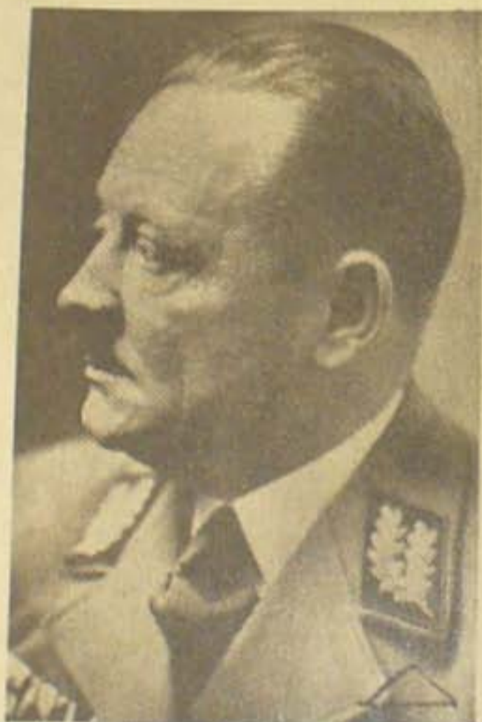
Erich Koch, Ukraines Bøddel.

Han kom til Danmark et Par Dage før Kapitulationen og menes at holde til i en tysk Flygtningelejr