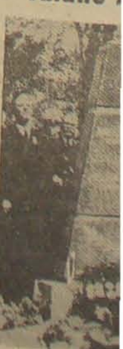
Paa Rødby Kirkegaard afsløret en Mindes- Allerede. Billedet Højtidelig