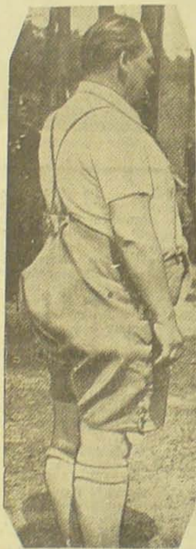
En af Görings mest raffinerede Bukseudgaver.

BEVOGTES AF AMERIKANSKE SOLDATER MED STØRSTE OMHYGGELIGHED