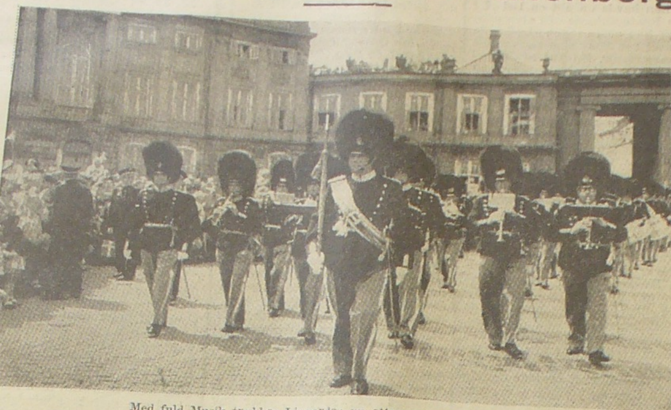
Med fuld Musik trækker Livgarden nu atter op paa Amalienborg.