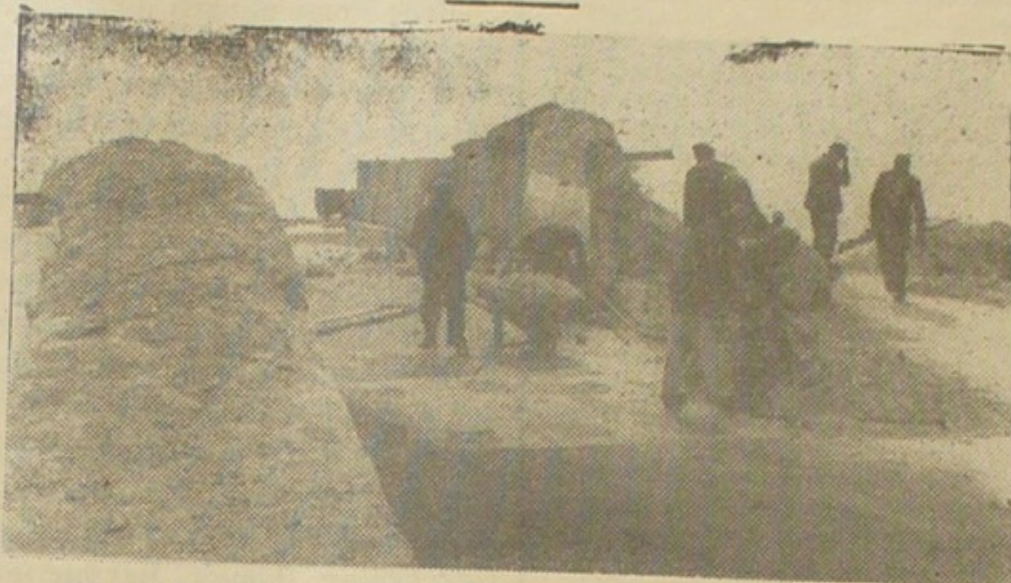
Et Billede taget under Sprængningsarbejdet i Dragsbæk.

Der findes 13—14 Cement-Vejspæringer, hvoraf den største findes i Dragsbæk.