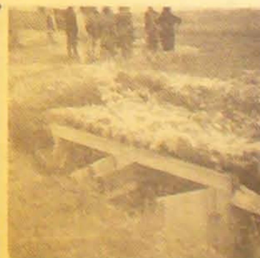
Sandheden ligger de farlige Panzerminer i Depotet natterfugt gravet ned i Jorden og kun dækket af lidt Brændevarer. Andre af Minerne ligger i Kasser oven paa Jorden, liggende tilgængelige. Det var et sandt nedgravet Depot. Flygtningelejren var nedbrudt.

Af en Konvoj paa ca. 30 blev 15 store tyske Skibe, fuldt lastet med evakuerede tyske Soldater fra Hela-Halvoen, sænket ved Bombefuldtraffere, og paa Christiansø anslaaes man Antallet af omkomne Tyskere til ca. 30,000. Da en tysk Hurtigbaad løb ind i Haynen paa Christiansø, frygtede Befolkningen russiske Luftangreb, hvorfor Behoerne evakueredes til