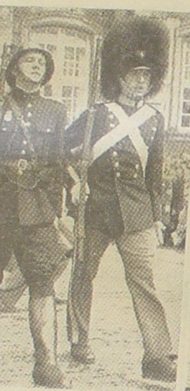
er Politiet paa Amalienborg Slotsplads.