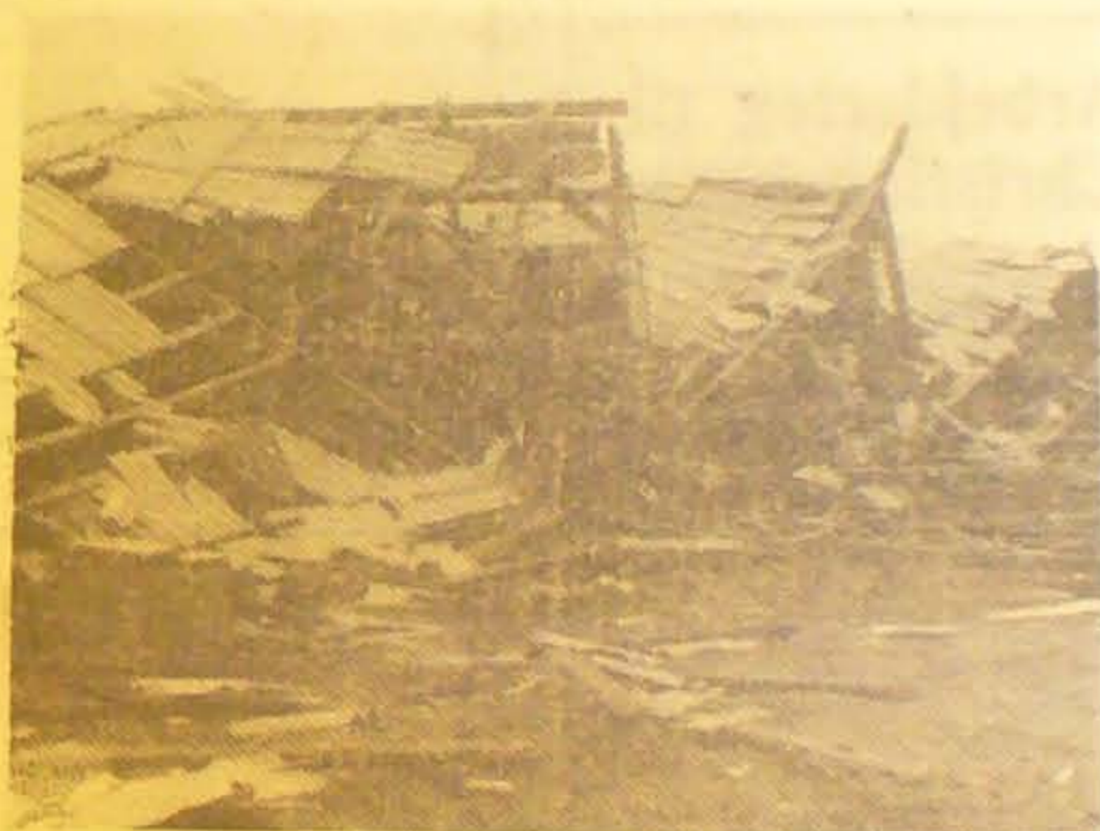
Et andet Billede, der viser, hvor haardt Mineeksplosionen har taget paa en Lagerbarak ved Flygtningelejren. Billede er taget kort Tid efter, at Eksplosionen skete.