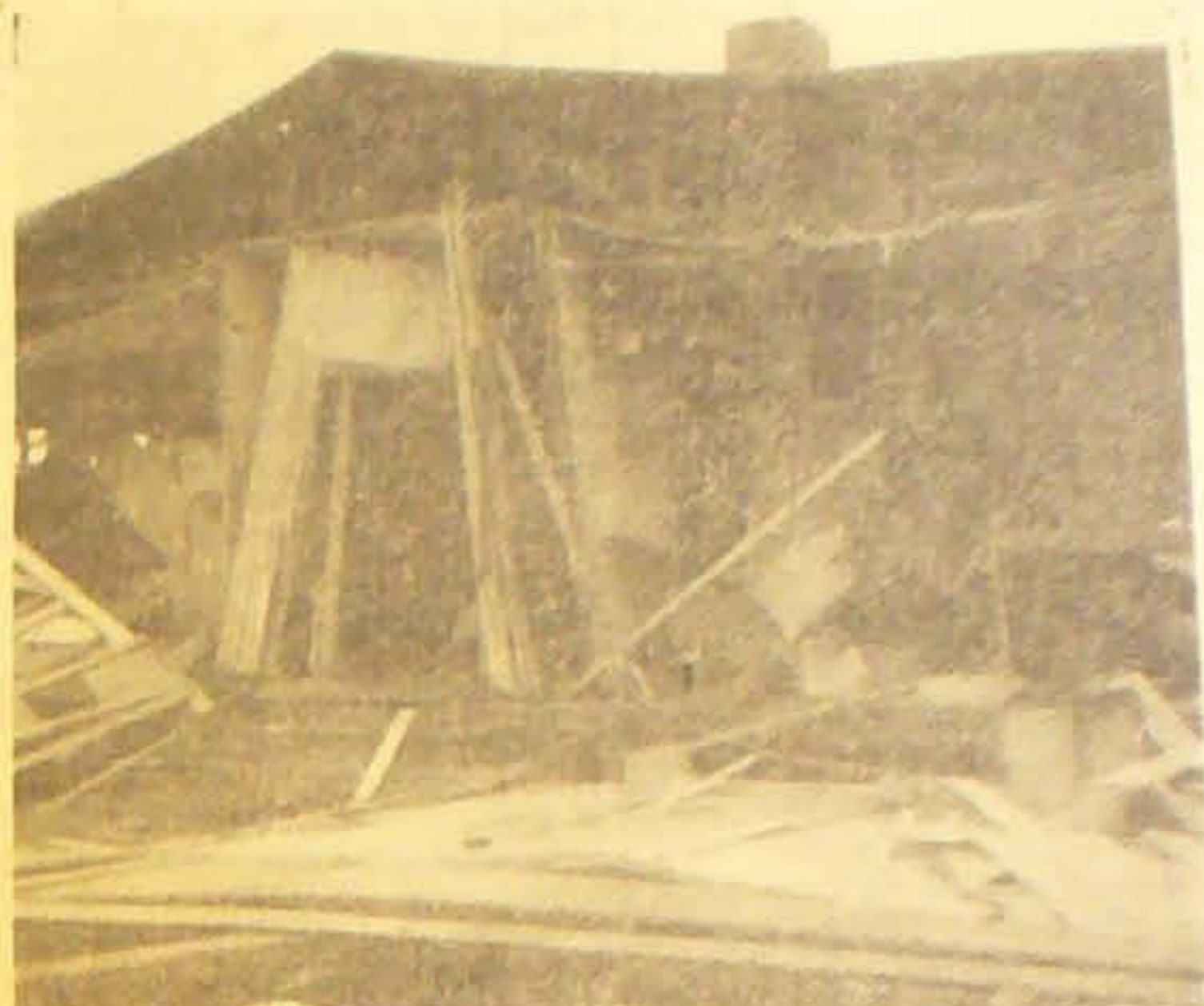
Vi bringer nogle Billeder af den ødelagte Flygtningelejr ved Tilstedev. Man ser her, hvorledes Gælden i den ene Eschschbarak er ødelagt, Høved er delvis styrtet sammen, og Flygtningenes slendige Bohave ligger luller til bulter mellem splintrede Sengestoder, Kasser, tomme Kuffertter osv.