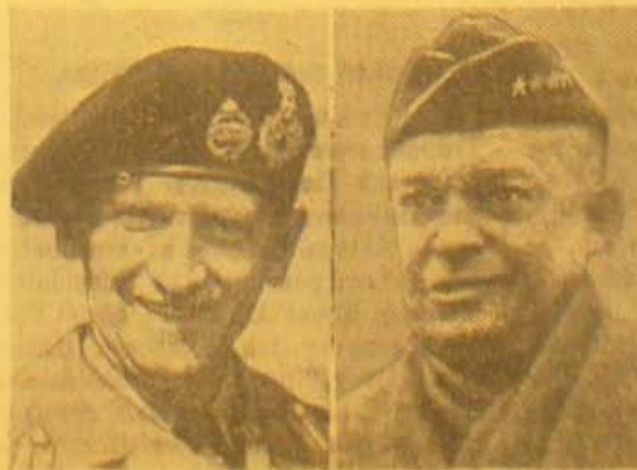
De Allieredes Repræsentanter i Kontrolraadet i Ty- den øverste Myndighed under Besættelsen. Fra

Et Billede Major Jac kort efter blev taget som ved d slap til Sv