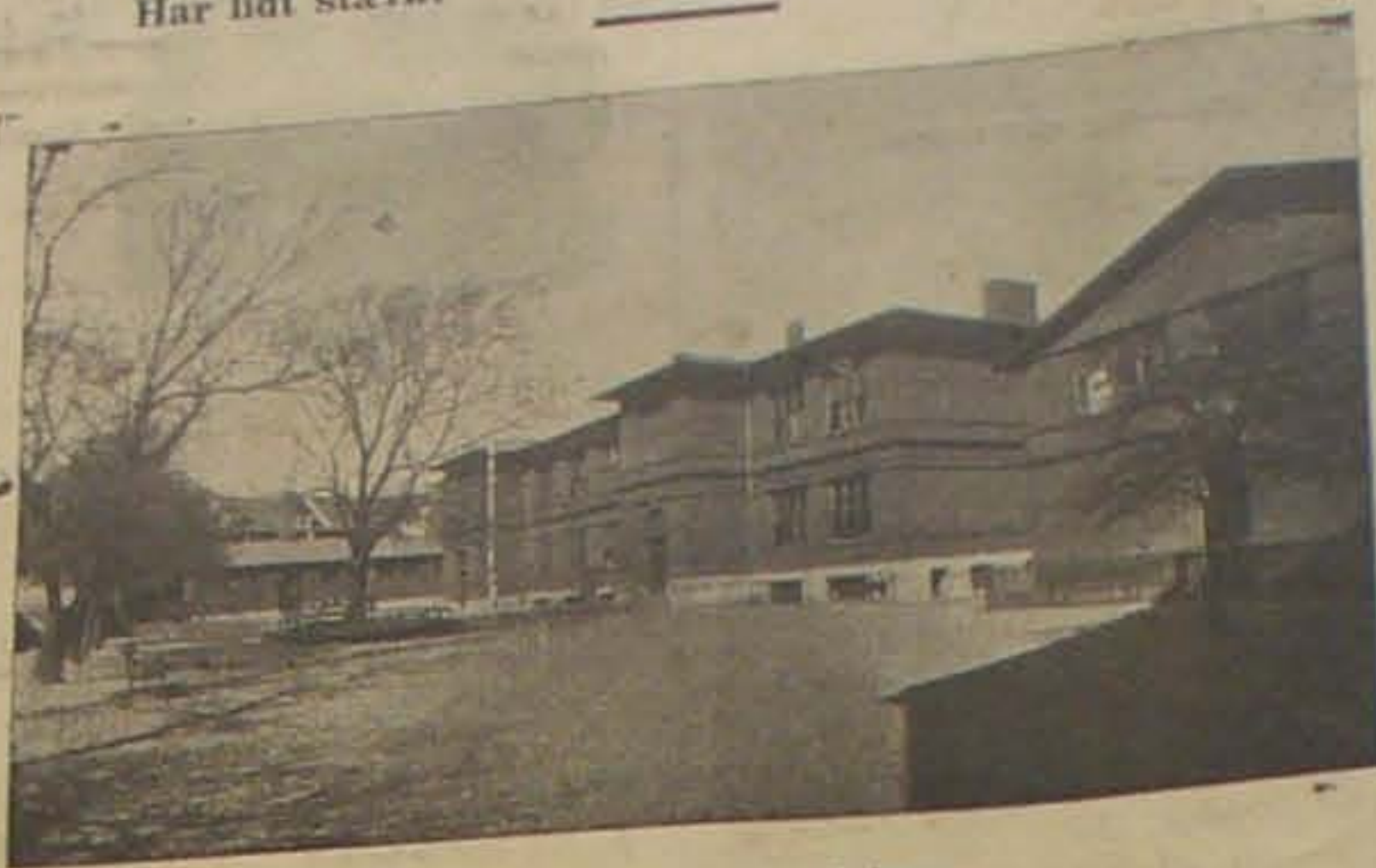
Vestre Skole set fra Gaardspladsen.

Har lidt stærkt ved i fem Aar at tjene som Kaserne.