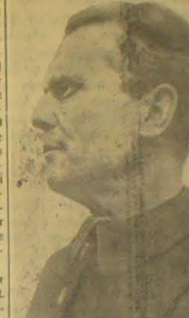
Marskal TITO, som gør Krav paa Kärnten.

allierede Tropper her i Landet, tidligere til Politiet under Jorden og til Fangerne i Frøslev. Danske Flygtninge, der vender hjem fra Sverrig maa henvende sig til deres tidligere Tobakshandler, hvis de ikke har været borte mere end tre Mdr., men ellers vil Rationeringsudvalget hjælpe dem, og der er tilsaet en Standardration for dem paa enten 60 Cigaretter, 30 Cigaretillos eller 70 Gram Shag pr. Maaned.