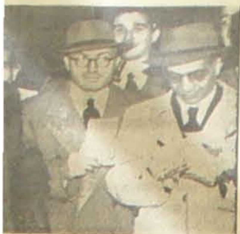
ing med Repræsentanter for alle de seks Regering er de Gasperi, som her ses eringsdannelsen.