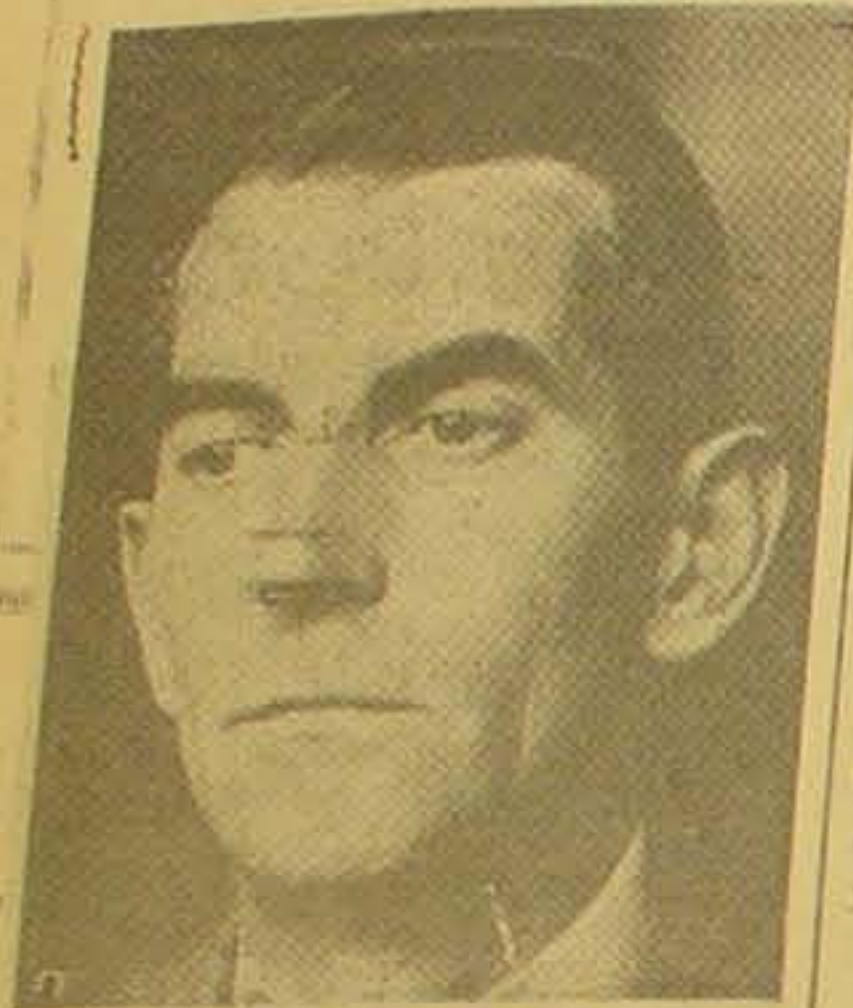
Oberst Orum, der er blevet udnævnt til Generalinspektør for Luftvaabnet.