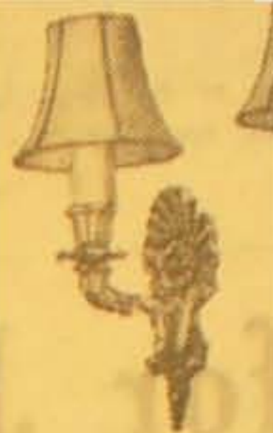
Lampetter laas i flere Størrelser fra Kr. 1125