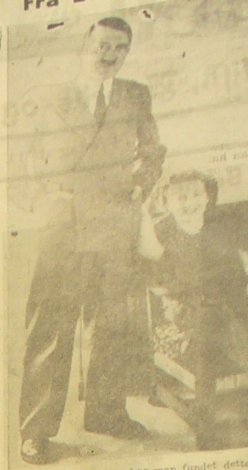
I Eva Brauns Arkiver har man fundet dette Storhedstid med sin Veninde