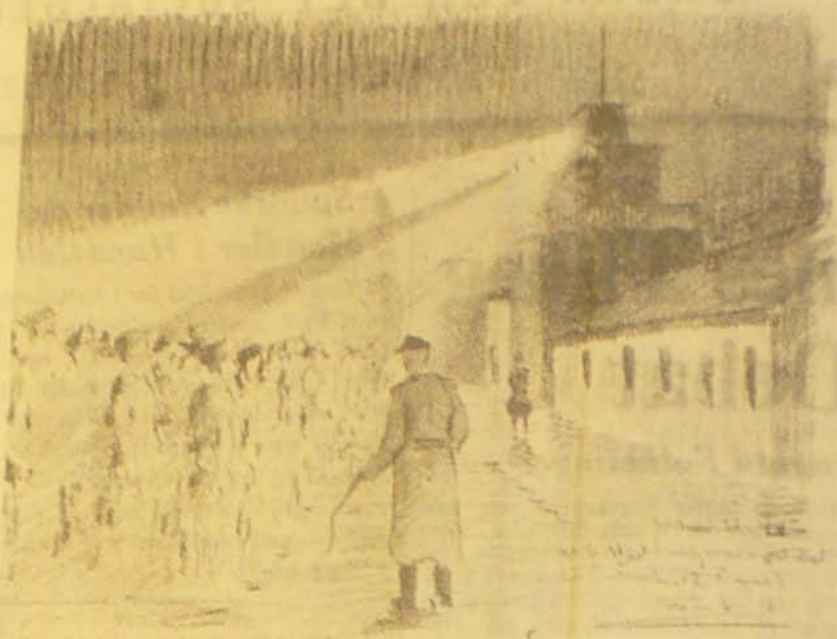
En af Axel Munk-Andersens Tegninger fra Buchenwald, hvor Politiet sammen med 50,000 andre Fanger hver Morgen maatte stille til Parade.

Fremragende Værk om Overfaldet paa det danske Politiet