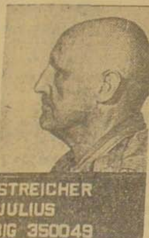
STREICHER JULIUS 3IG 350049