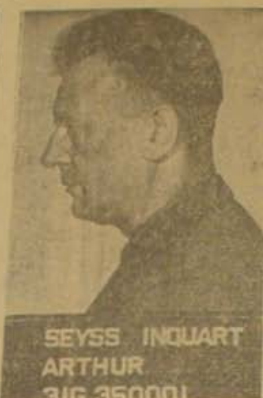
SEYSS INQUART ARTHUR 3IG 350001