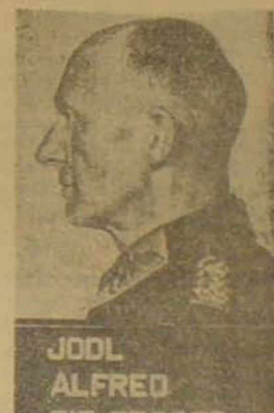
JODL ALFRED 3IG 350026

Fra de Allieredes Krigsforbryderalbum En Række af de store Krigsforbrydere, som de tager sig ud i de Allieredes Forbryderalbum, Processen mod dem begyndte i Formiddags.