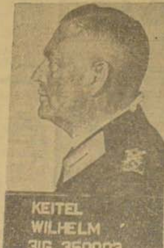
KEITEL WILHELM 3IG 350002