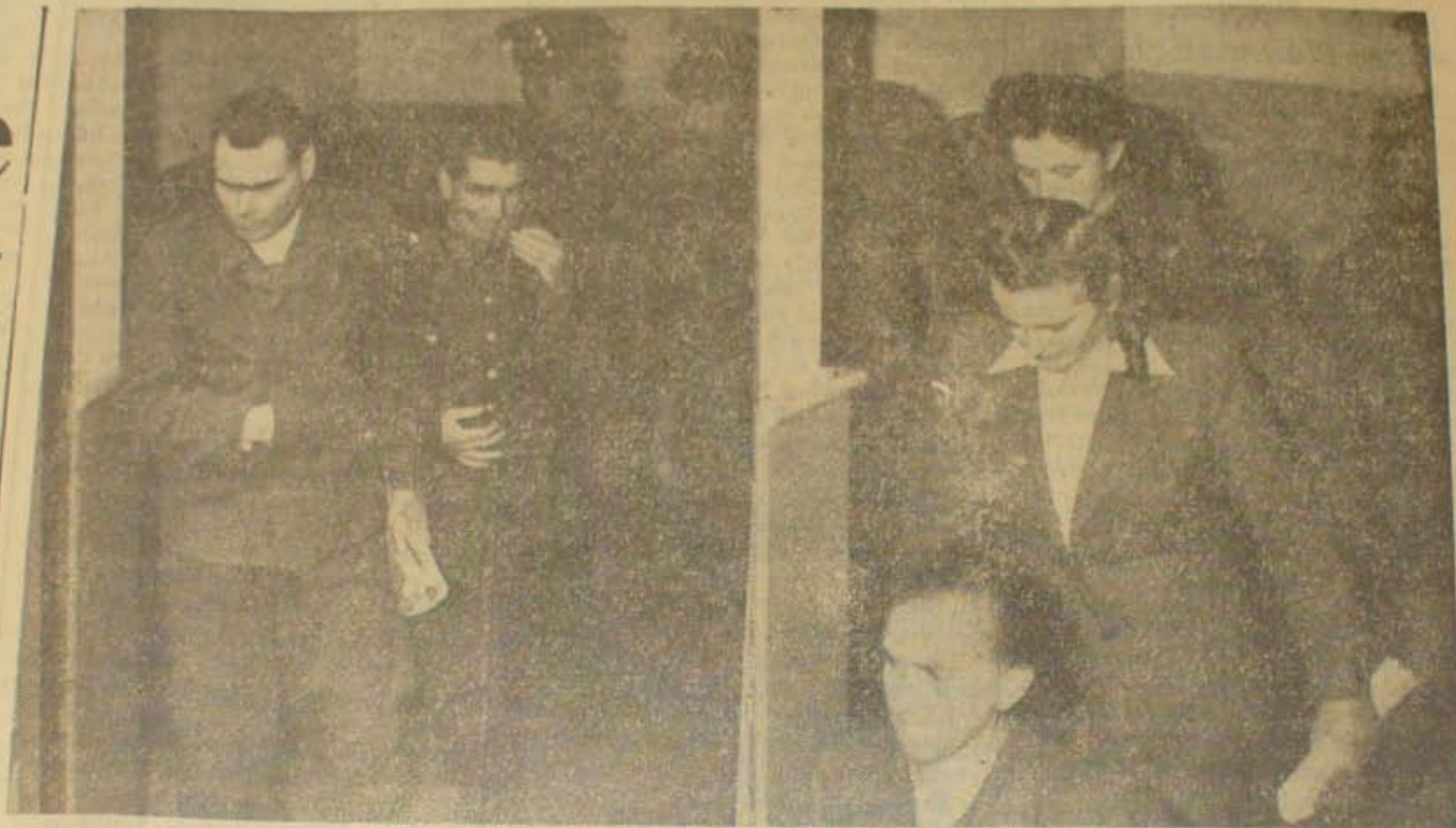
Efter Dødsdommene - To Billeder fra Retsbygningen i Lüneburg efter Domsafsigelserne over Forbryderne fra Konzentrationslejrene. Til venstre Josef Kramer , Vilddyret fra Belsen, og ved hans Side i Uniform, Lejrdoktoren Klein , der begge dømtes til Døden ved Hængning. Paa højre Billedede nogle af de dømte Kvinder. Som Nr. 2 ses Irma Greese , der ogsaa dømtes til Hængning.