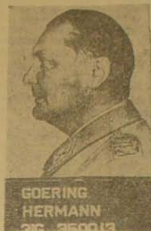
GOERING HERMANN 3IG 350013