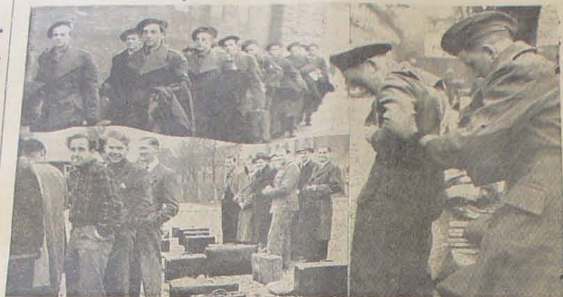
Et Par Billeder fra de store Indkaldelser, der finder Sted i disse Dage. Øverst en Flok unge Mennesker, der lige har faaet de nye Montyuniformer, som de skal bære ved Besættelsestjenesten i Tyskland til sin Tid. Derunder en Flok unge, der venter paa at komme i Trojen. Til højre hjælper et Par Kammerater hinanden med at finde ud af det nye, uvante Beklædningspørgsmaal.