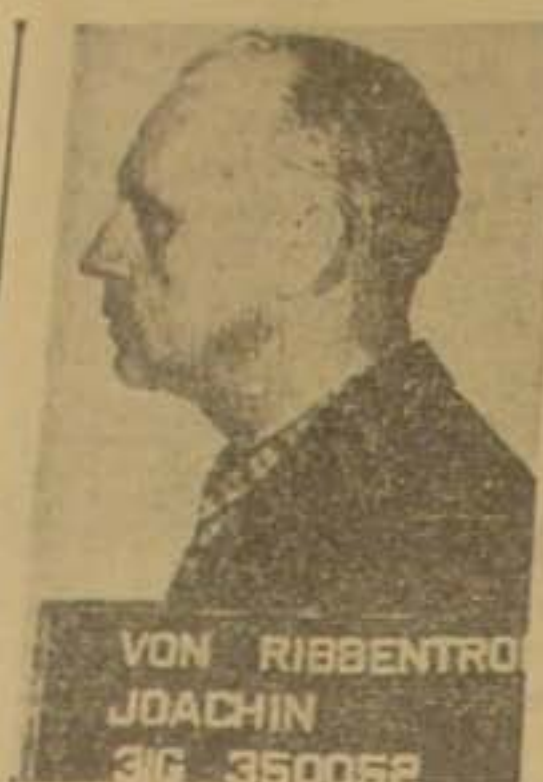
VON RIBBENTROP JOACHIM 3IG 350052