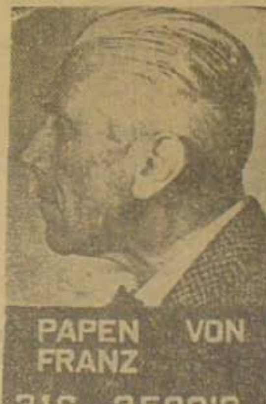
PAPEN VON FRANZ 3IG 350018