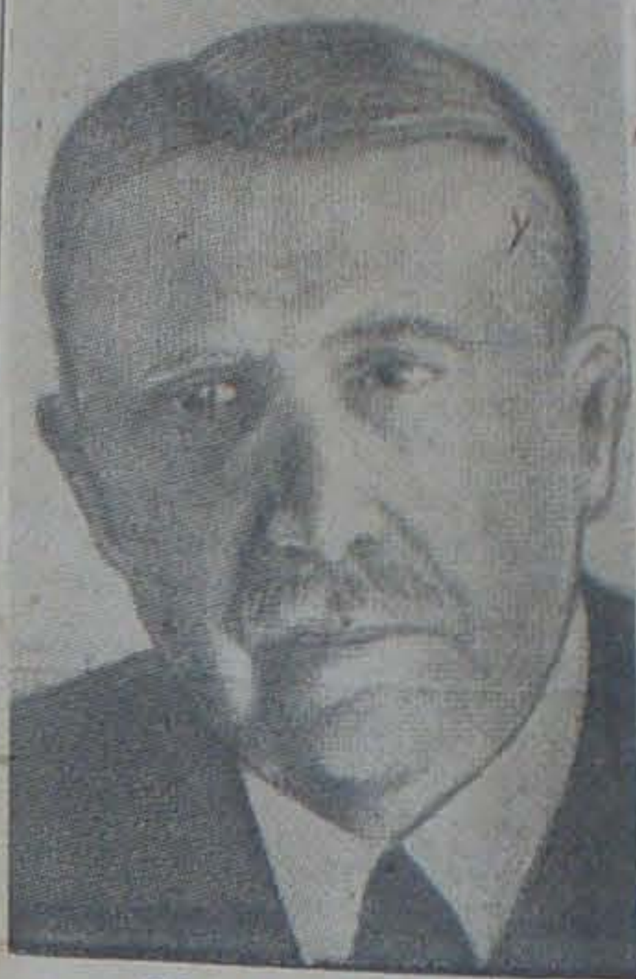
Eduard v. Steiger, som er blevet valgt til Schwelz' Forbundspræsident for 1945.