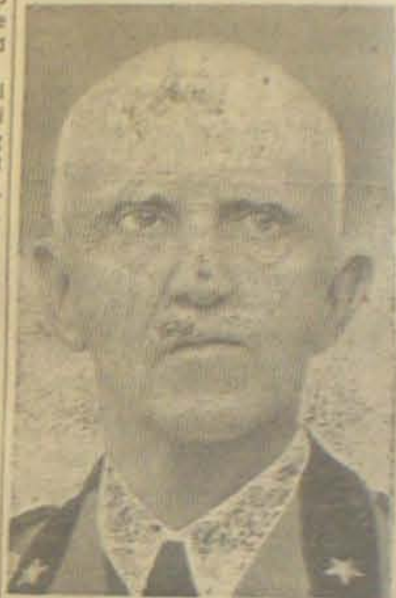
Ekskong Victor Emanuel