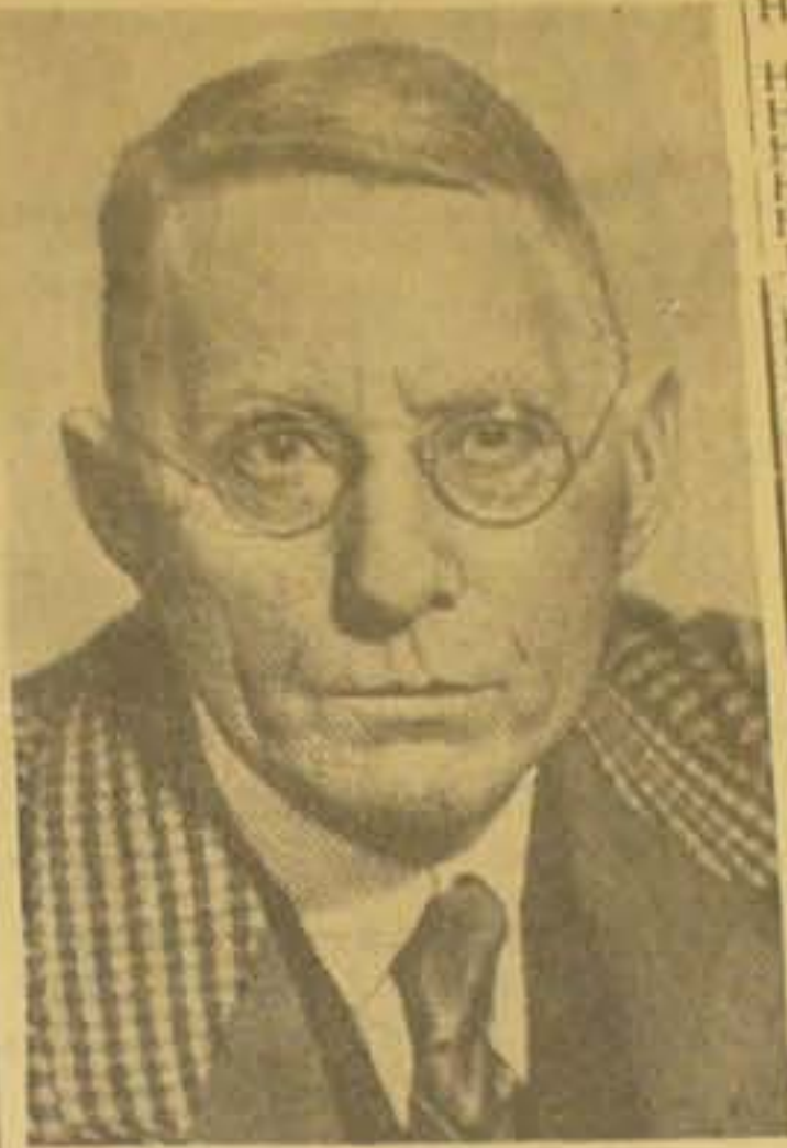
Johannes V. Jensen,

A a r h u s. Efter Bestemmelse fra Statens civile Luftværn er Distriktskommandocentralerne fra i Alles Kl. 18 blevet bemanded med det sædvanlige Mandskab. Der ventes i de nærmeste Dage udsendt Instruktioner fra Statens civile Luftværn vedrørende Luftbeskyttelsen i Byerne.