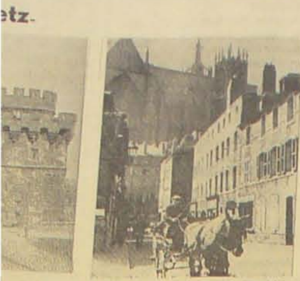
Gadeparti i Baggrunden Domkirken.