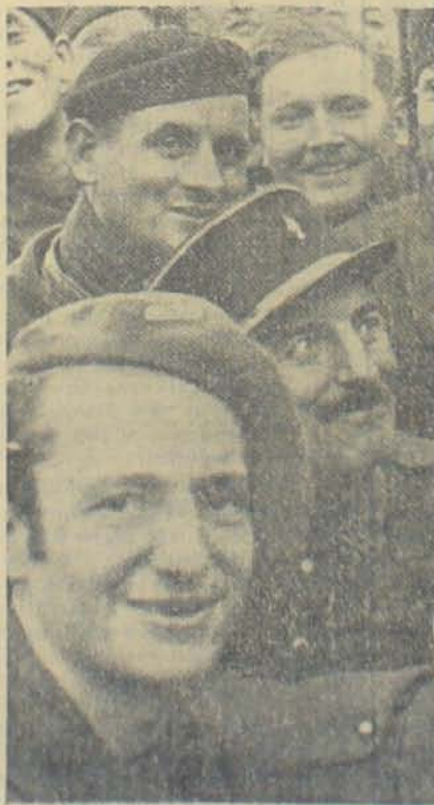
Her bringer vi et Billede, der er taget i en Visesanger Maurice Chevalier