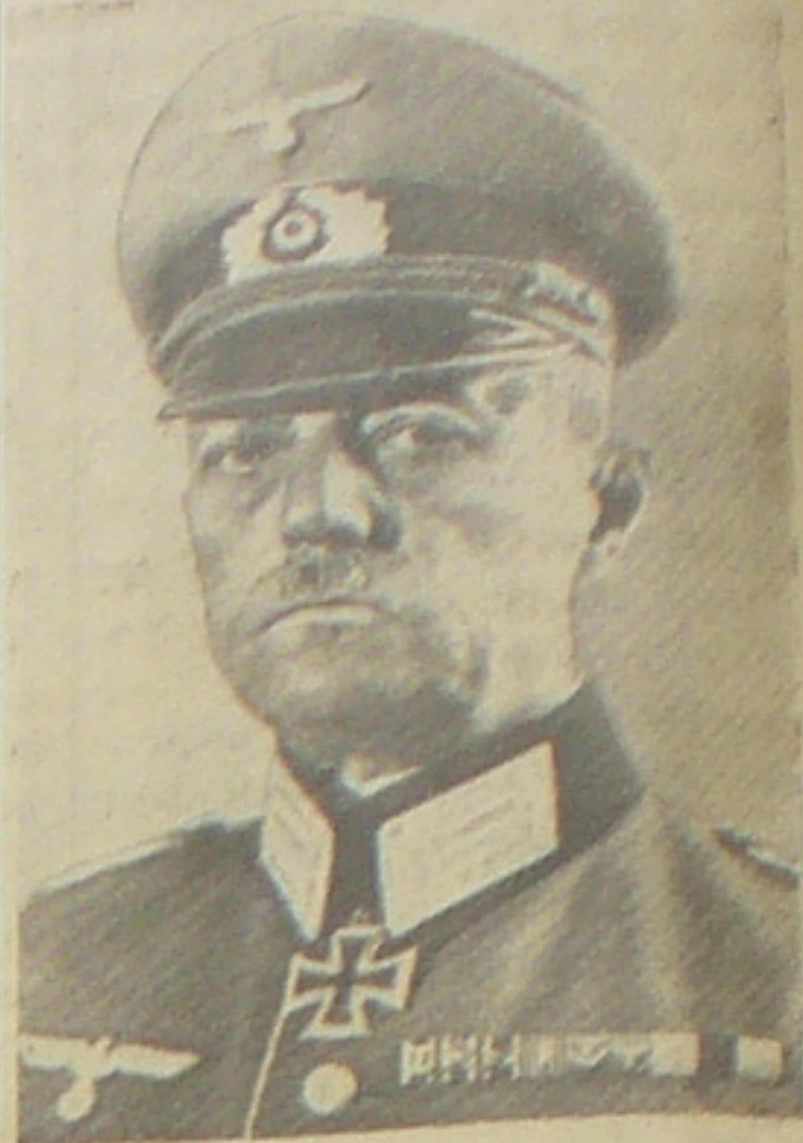
Generalfeltmarskal von Rundstedt

Hvor store Styrker, der er sat ind fra allieret Side vides ikke, men fra tysk militært Hold erfares, at det ogsaa ved de nye Landsætninger Natten til Onsdag drejer sig om adskillige Divisioner, og at der overalt er haarde Kampe i Gang. Efter 1½ Dagns Forløb er de allieredes strategiske Plan bleven klar, fremhævede man i Aftes i tyske militære Kredse. Hovedstødet er rettet mod Kyststrækningen mellem Cherbourg og Le Havre, hvor det er lykkedes at oprette nogle Brohoveder. De allieredes Bestræbelser gaar nu ud paa dels at udvide disse