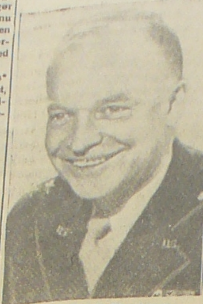
General Dwight Eisenhower

Invasionen skal komme til fuld Udfoldelse, før det afgørende Slag indledes, erklærer man i tyske Militærkredse