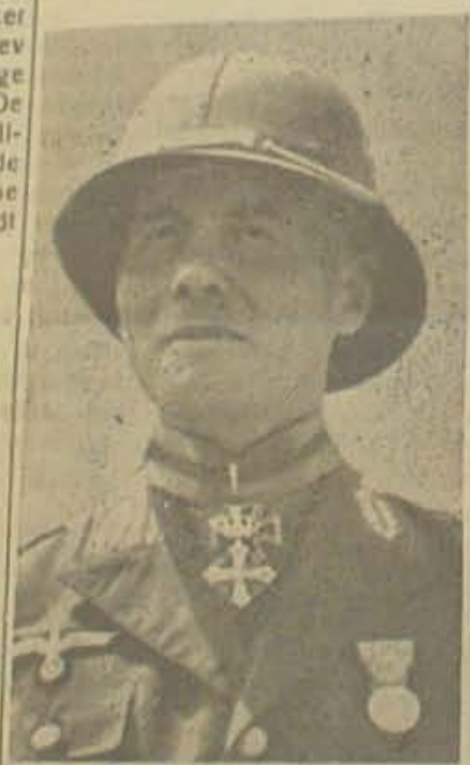
Feltmarskal Erwin Rommel

Berlin. De allierede Styrkers Angreb paa Europas Vestkyst indlededes ved et usædvanlig voldsomt Bombardement af Befæstningsanlægene ved Frankrigs Kanalkyst. Natten mellem Mandag og Tirsdag indtraadte en kort Pause, i hvilken Stilheden raadede. Krigsguden trak Vejret, før han slap de mægtige Kræfter løs, der nu er tøret sammen for at afgøre den anden Verdenskrigs sidste Runde.