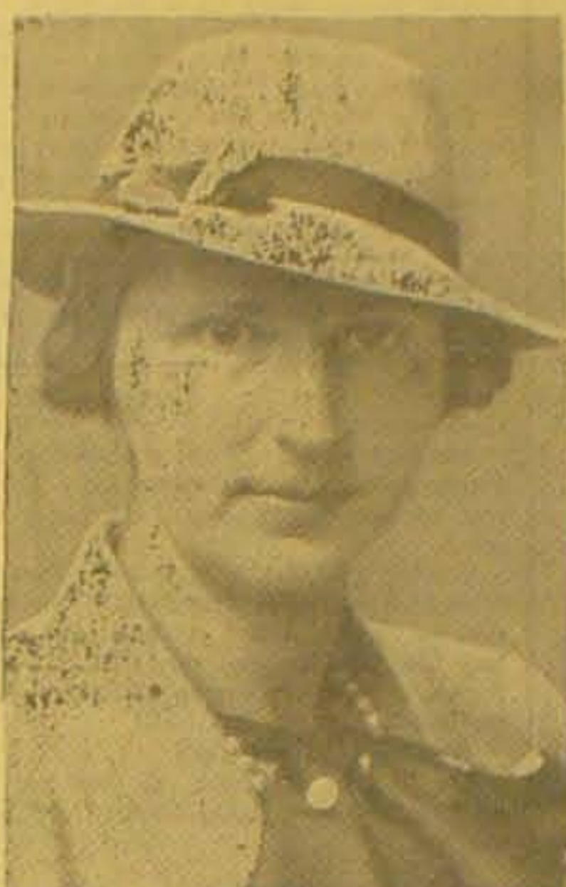
Enkedronning GIOVANNA af Bulgarien.

Til den, der giver de tyske Myndigheder Meddelelser af en saadan Art og derved bidrager til Forhindring af planlagt Sabotage, Paagribelse af Gerningsmændene eller Beslaglæggelse af Sprængstollagre, udloves der en høj Belønning. Denne fastsættes i hvert enkelt Tilfælde af Sabotage til et Beløb af indtil 20,000 Kr. Der tilsikres forholdsvis Behandling af Anmeldelserne.