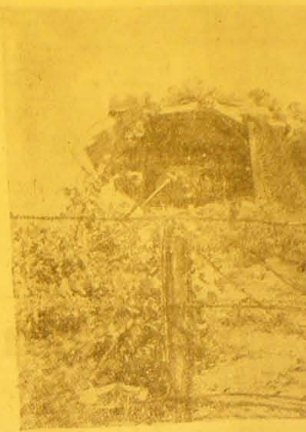
Som meddelt er Tropper af 8. britiske brien ved Messinastrædet.

Begunstigelse af Fjenden i udvidet Betydning i Henhold til ovennævnte Bekendtgørelse er ogsaa ethvert Forsøg paa indenfor en Bedrift at anstifte Uro eller opfordre til Strejke. Enhver dansk Statsborger maa være paa det rene med, at de mod det tyske Rige fjendtligt sindede Magter har forsøgt og fremdeles vil forsøge at gøre Danmark til et Arnested for Uro for paa denne Maade at vanskeliggøre de tyske Besættelsesmyndigheds deres Opgave. Den, der direkte eller indirekte understøtter saadanne Forsøg, maa følelig regne med paa Grundlag af den militære Undtagelsestilstands Bestemmelser at blive straffet nøjagtig ligesaa strengt og haardt som den, der aktivt er delagtig i Handlinger, som er rettet mod det tyske Riges og den tyske Værnemagts Interesse.