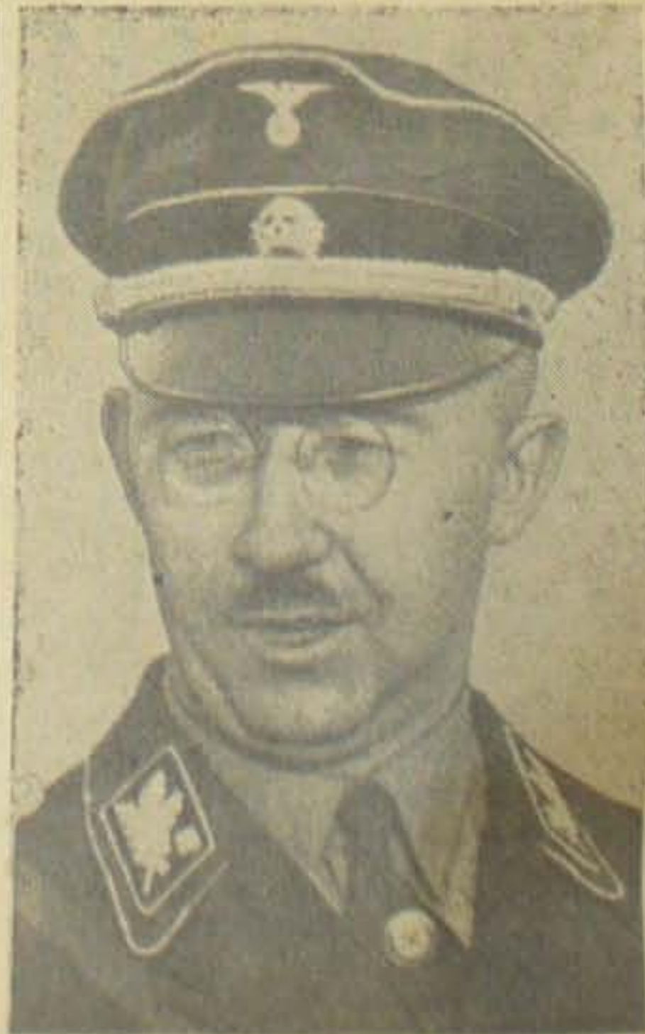
Heinrich Himmler, den tyske Gestapochef, der er blevet udnævnt til Indenrigsminister.