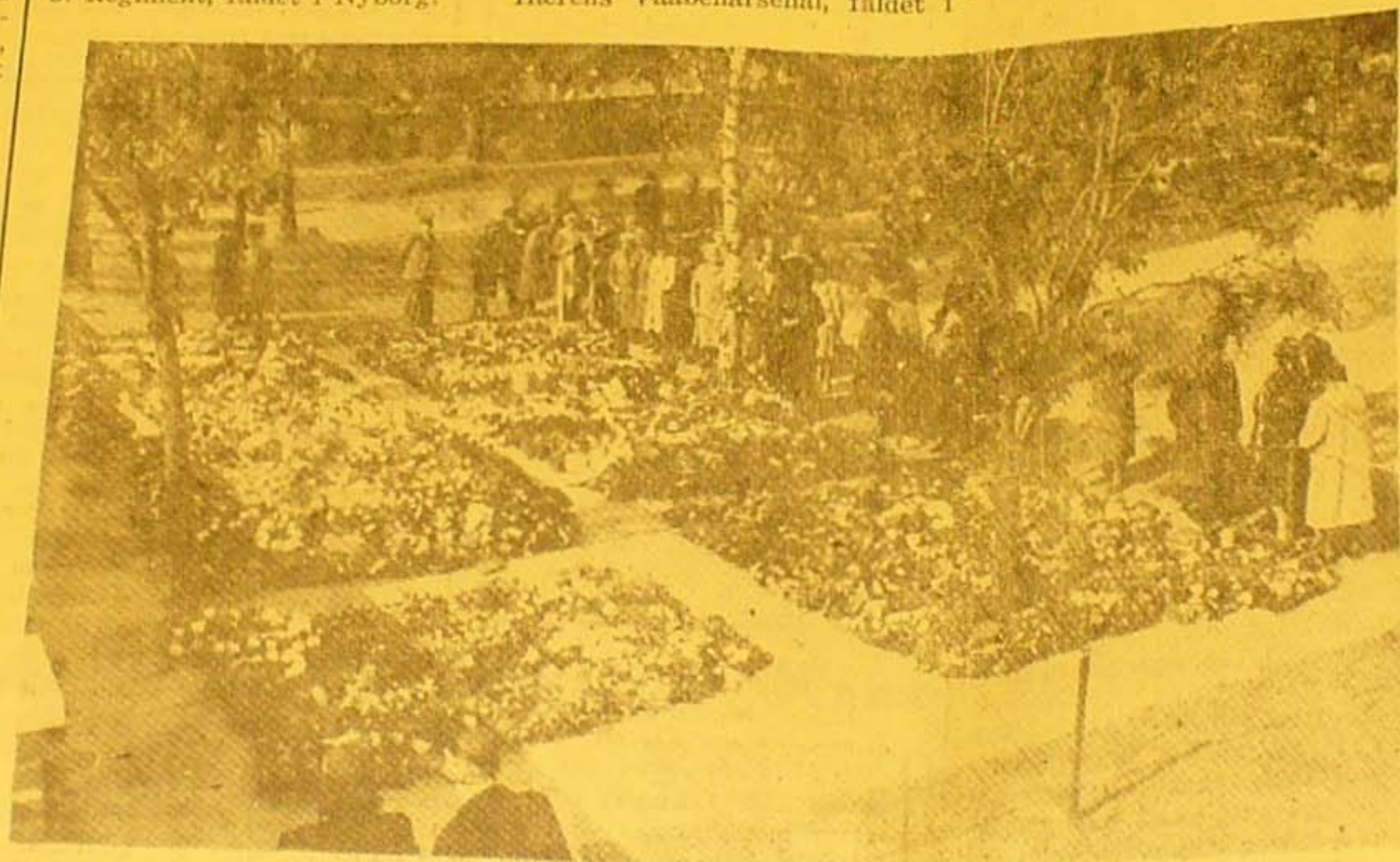
Slægtninge og Venner til de faldne danske Soldater har i disse Dage smykket Gravene paa Bispebjerg Kirkegaard i København med Eftersommerens Blomsterpragt. Hver Dag besøges Gravene af mange Menesker.