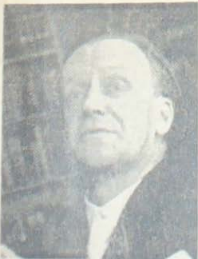
Strandgaard, København. Bilden er taget af

Finisterre blev der i en Krydser i Eskadre samt en Torpedojager eksploderede og sank efter Bombetreflere.