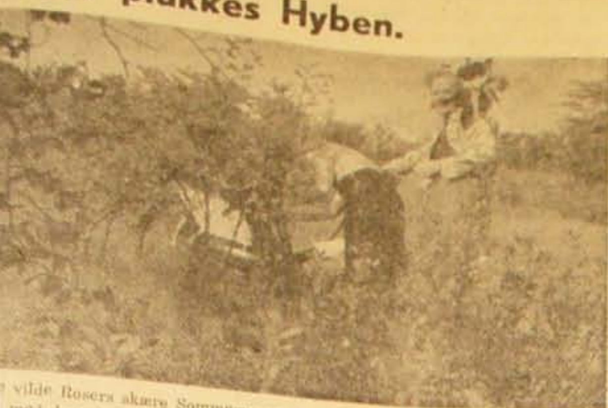
De vilde Rosers skære Sommerpragt er forlængst forbi, nu pranger Buskene med de røde Hyben, og mange samler de vitaminrige Frugter til Syltegrøden.

paa et Vandfad og føre den til Hovedet. De tilstede, som alle var Hedninger, d ham ikke, og Manden d en at blive døbt. Sonnen or sent til Faderens Døds- da han igen stod i Menig- Forsamling og vidnede, det et mægtigt Indtryk tilstedeværende, da han dem om sin Faders Bort- at det gjaldt om at væ- Som det gik denne Mand raet mange. Havde de deres Endeligt var nær, i Tide gjort Alvor af at sig. Ogsaa her gælder d, at dersom Manden i idste, paa hvad Tid Ty- gøre Indbrud, saa va- og tillod ikke, at der brud i hans Hus.