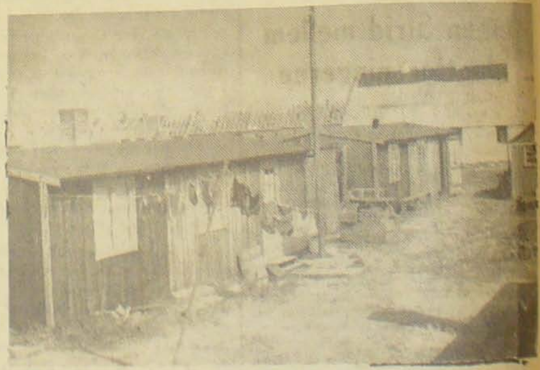
Nogle af de Barakker, Staten har ladet opføre til de evakuerede Hanstedfiskere.