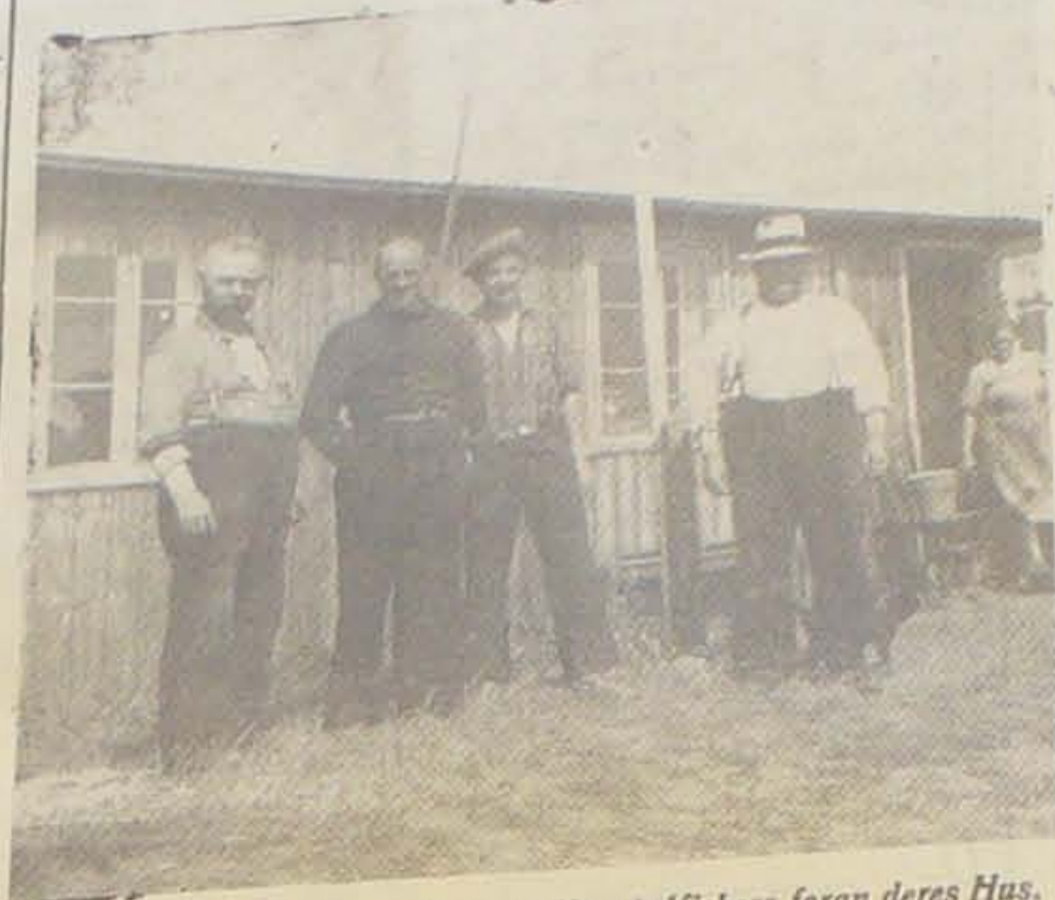
Optimisterne mellem de evakuerede Hanstedfiskere foran deres Hus.

De vil hjem igen, saa snart der viser sig Mulighed herfor.