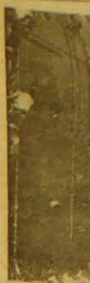
Fra Stillehavsamerikanske Tropper under ved Salomonøerne. Soldaterne er taget om Bord