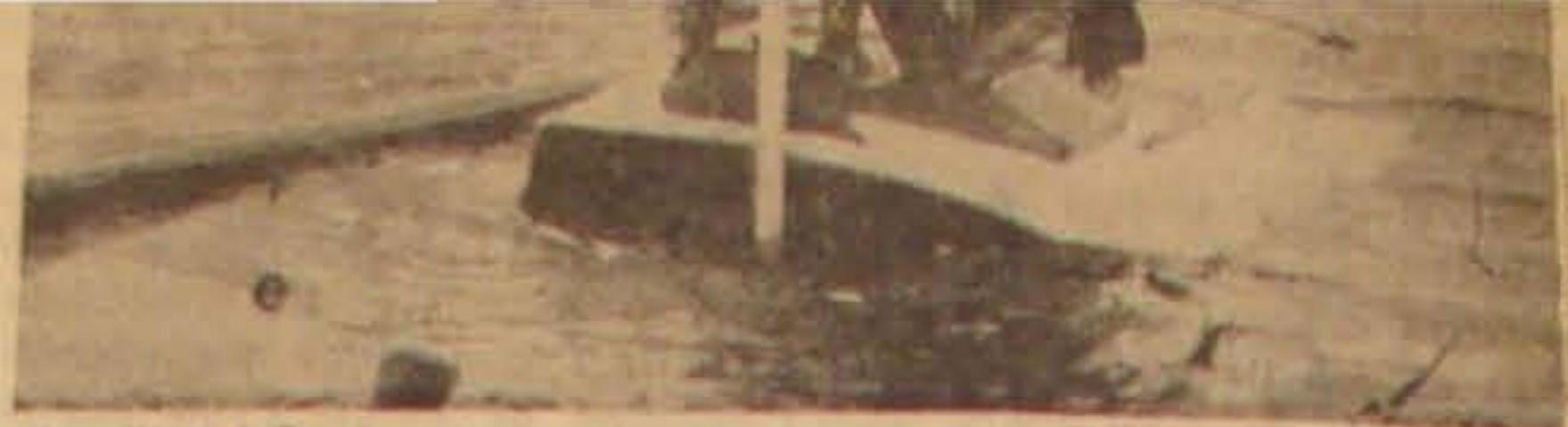
Sepolitiet i Færd med at undersøge Vraget af Kutteren „Goon“, der i Paaskedagene blev sendt til Bunds af en Brodse, hvorved 5 Mennesker druknede.

...erfarer Fredag: Fart fra København til lmo er den svenske Færge i rheden af Svenskekyaten lø- paa en af engelske Flyvere astet Mine. Færgen blev be- lget og sat paa Grund. In- Mennesker kom til Skade.