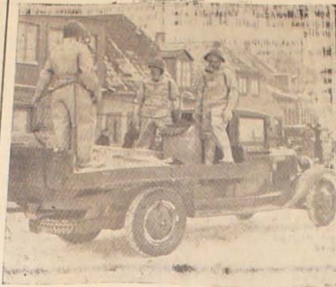
Gasporere paa Arbejde, fotograferet under en af Vinterens Luftværnsøvelser.

Lyder Sirenerne i Morgen Aften, er det Alvor. — Det henstilles til Befolkningen ikke at være nysgerrig og færdes med Forsigtighed.