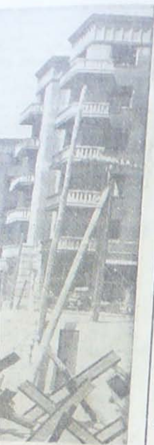
har dannet det ene af ten.