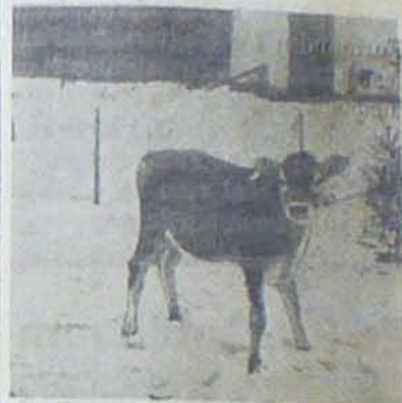
En af Gevinsterne i Luftværnslotte- riet den lille Jersey-Kviekalv fra Tra- nekær Slots Ladegaard.