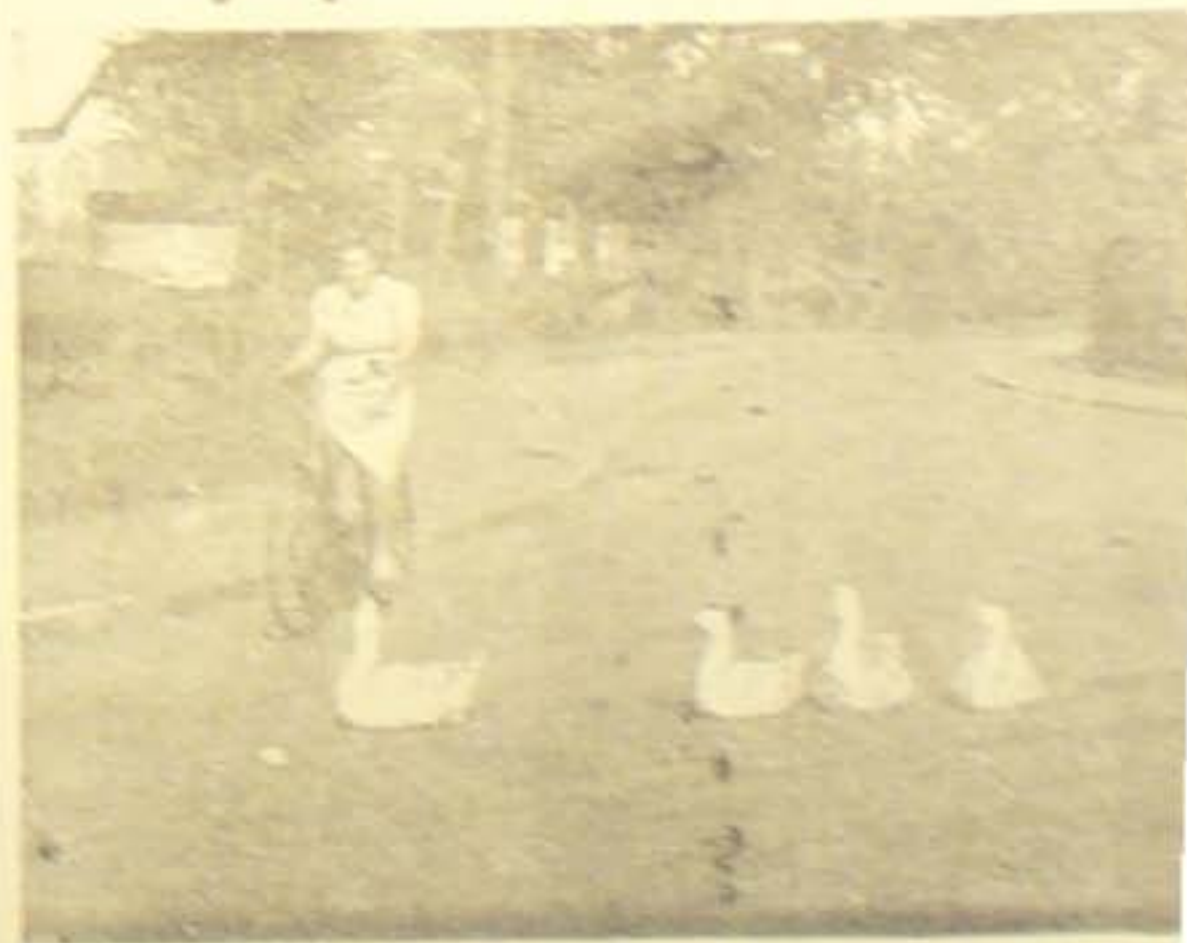
Firs Gæs, der paa Trods af alle Færdselsregler har slået paa København.