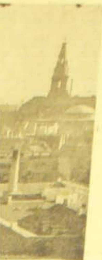
en Næstved Byen med den til venstre Næstved