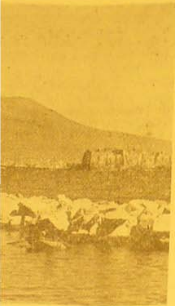
...nverdenen. Her ses den be-