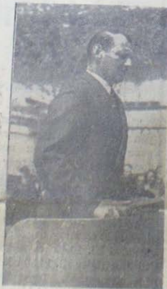
Kronprinsen under Aabningstalen.

Kronprins Frederik erklærede derefter Udstillingen for aabnet med Ønsket om, at den maatte blive til Gavn for de to Foreninger.