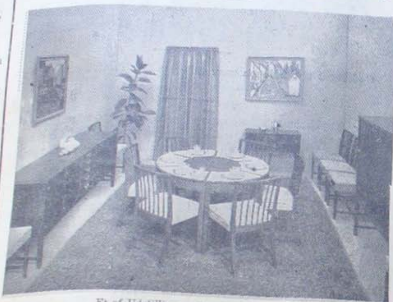
Et af Udstillingens Stuearrangementer.

I Forum i København aabnede Kronprins Frederik i Torsdags Skandinaviens hidtil største Møbeludstilling, som omfatter 92 Stuearrangementer med Seriemøbler.