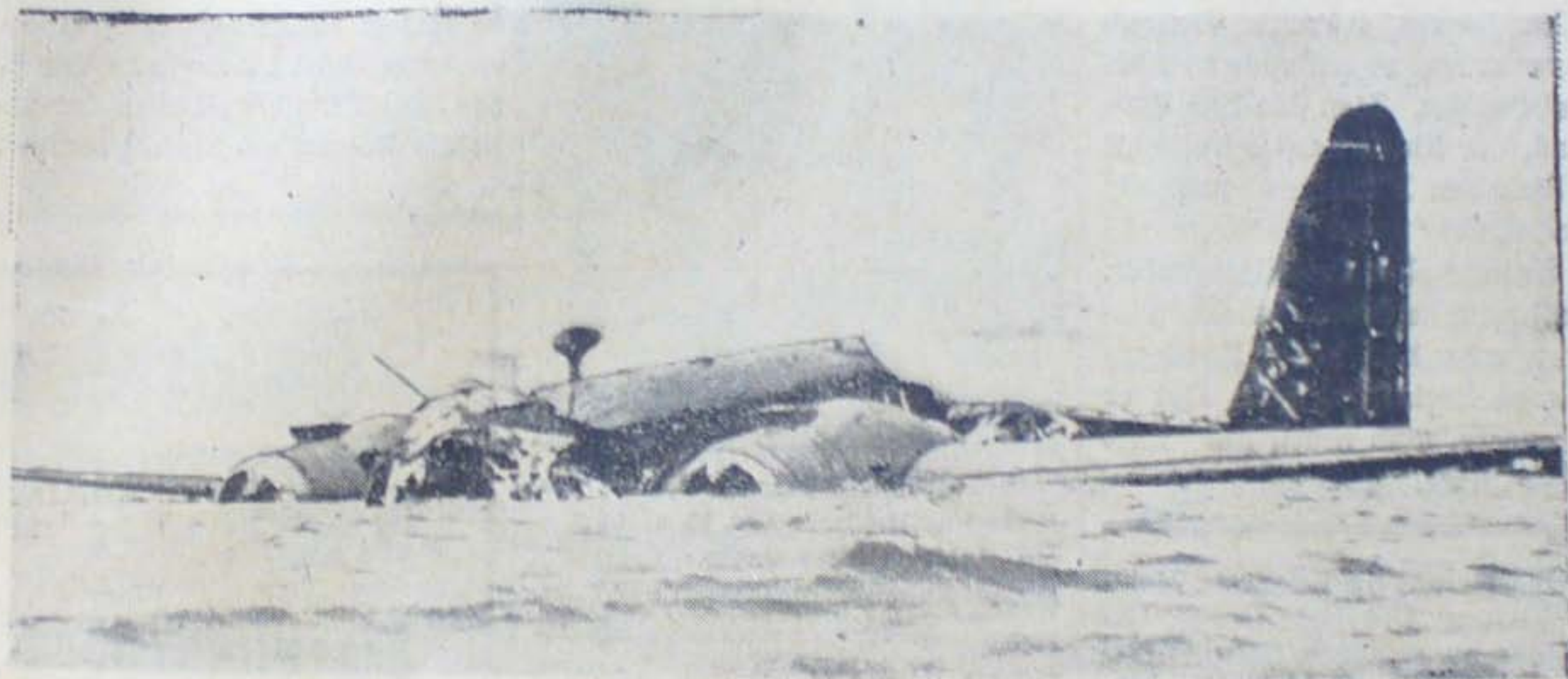
Engelsk Bombemaskine, som under Indflyvning over Danmark er blevet skudt ned af Luftværnet og styrtet i Vandet ikke langt fra Land.