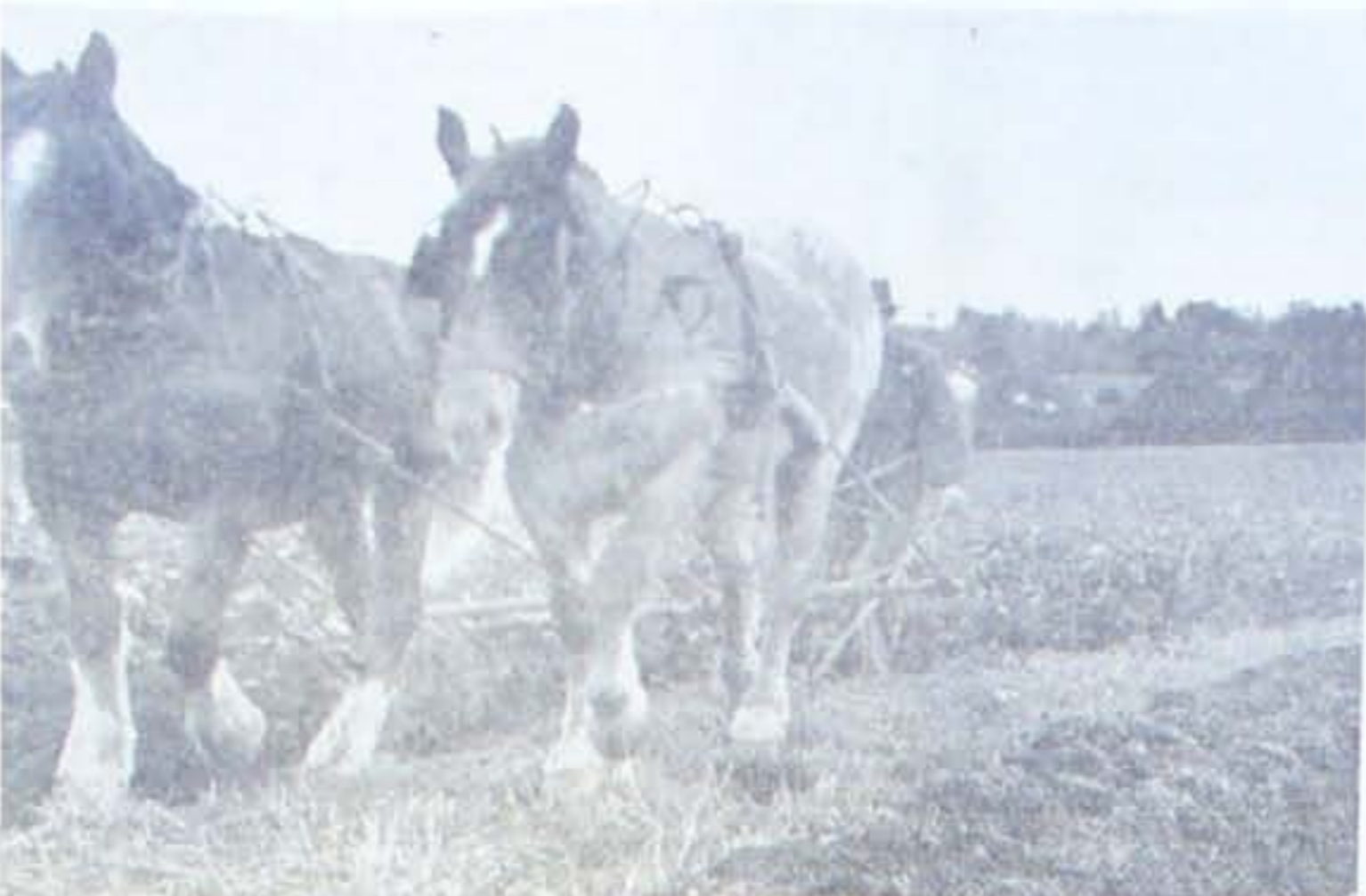
Krager flakker om Plojemanden, trækker de to hirse vindig Ploven, Fure efter Fure af den brud vendes, og Regn og Sol veksler med Storm. Efteråret over det danske Land.

man herigen- Prieregulering, na Henseende med Ordain- unde for saa som de der- e paa at faa ris, der sva- malpriserne. gaaet imod — og heri af mange ge ved at Monopo- de. Stats- Slagterne de bevaret kan købe selv væl- have. De