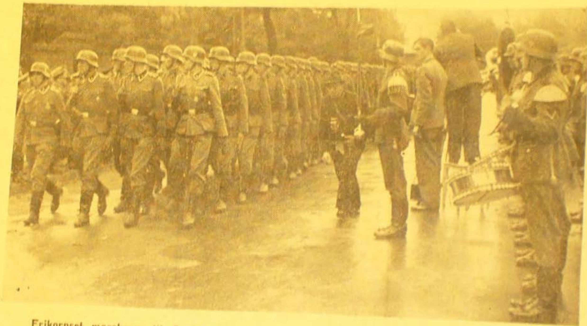
Frikorpset marcherer til Godsbanegaarden, hvor Afrejsen fra København fandt Sted Tirsdag For- middag.

Byt Mar de l Fjen nu Fr Anl Wig en Se lysk tetg lige sund sko 23,4 Kap Pan pan de t til Man var Egy samt pan Fjen har And det sikre