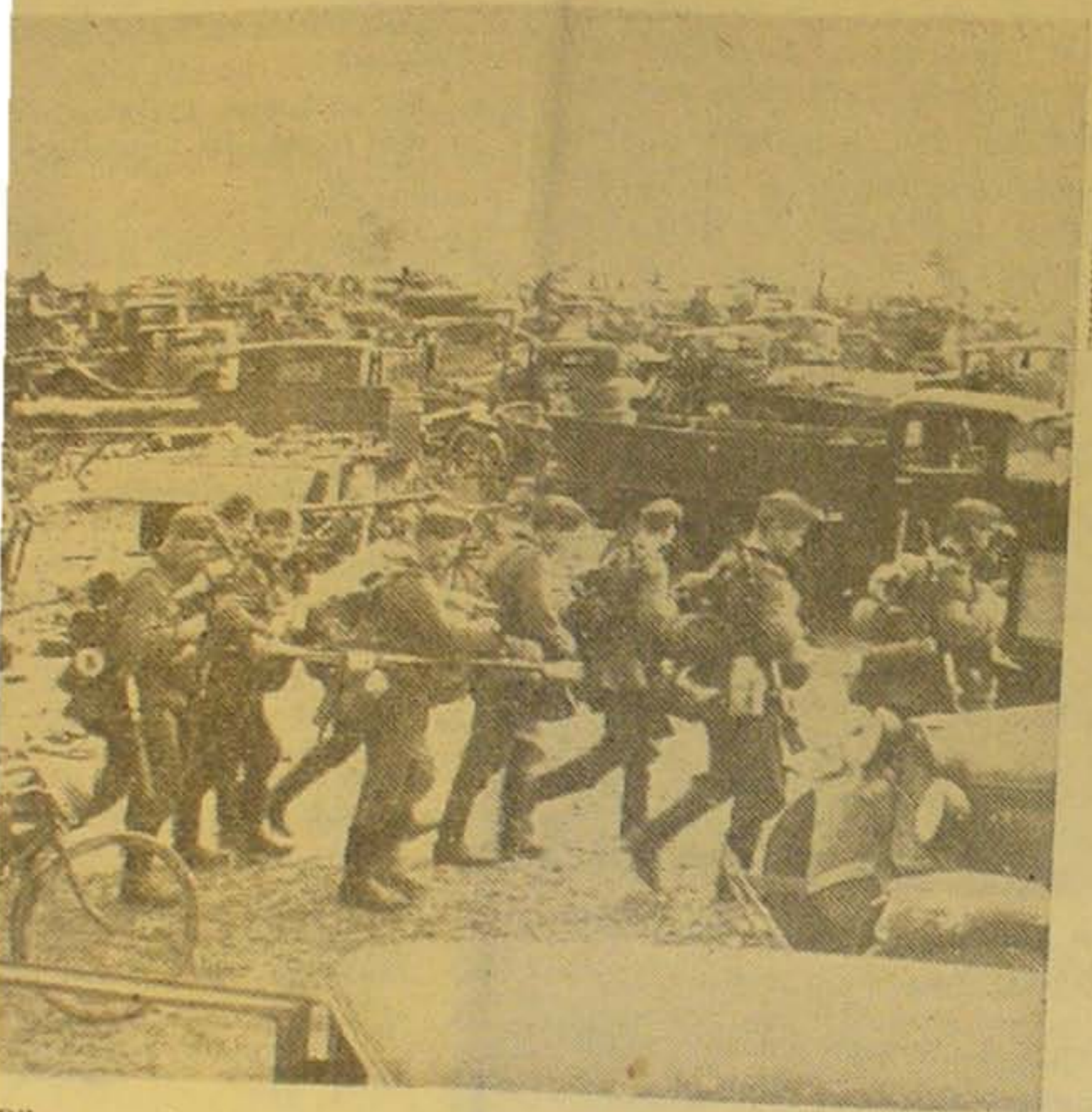
Biler og andet Krigsmateriel, der er erobret fra Russerne.