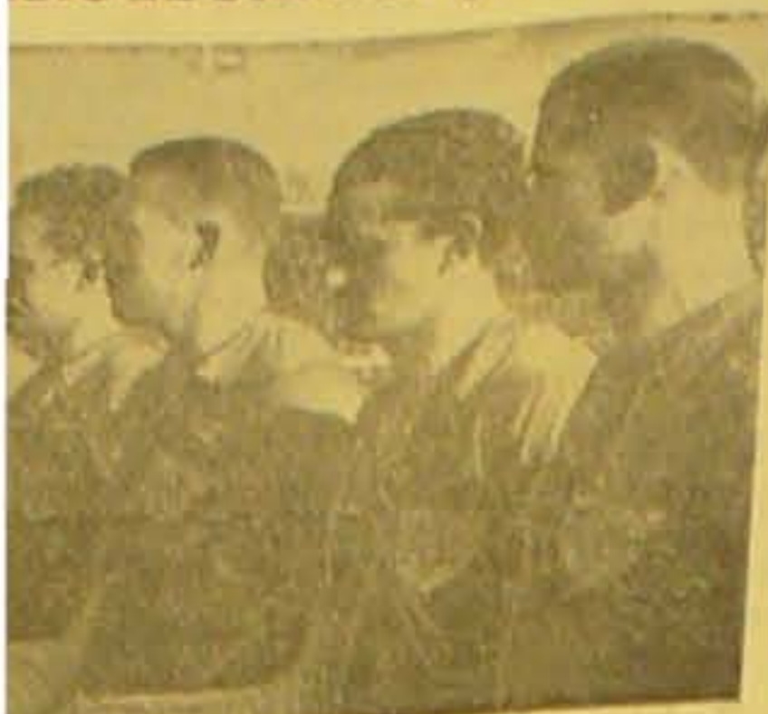
... paa det afjendende danske Hold.