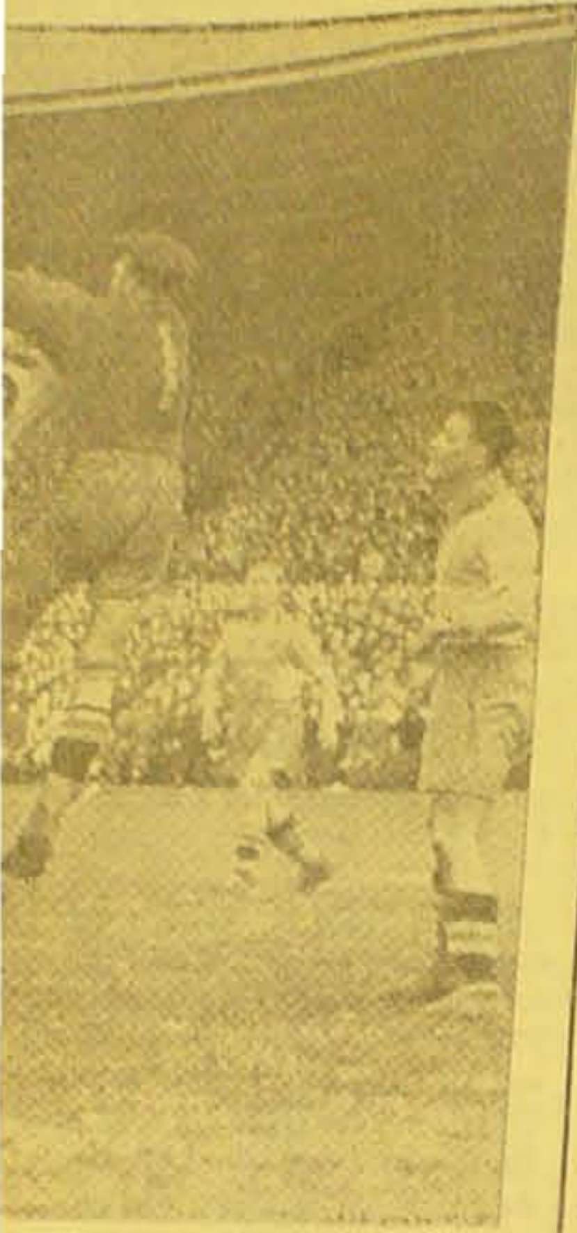
... fra den spændende Kamp.