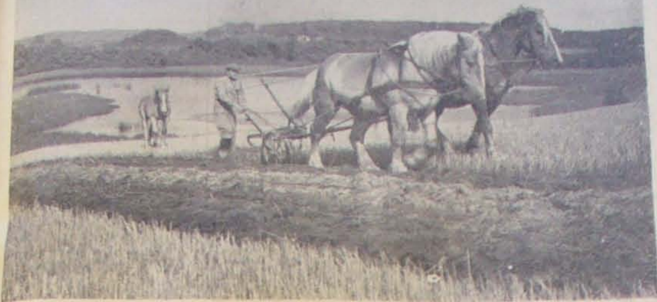
Høsten er bjerget, Hesteriven har kæmmet de stride Stubbe, og Ploven vender nu de øverste Tommer af Marken, saa Straa igen kan blive Muld. - Bymanden, som cykler forbi det skønne Sceneri, misunder Plovkarlen bag de svedige Heste. Men Plovkarlen har ikke Tid til at misunde nogen. Furen skal passes, og kun naar Ploven vendes, kan han lade sit Blik glide ud over det skønne Landskab.