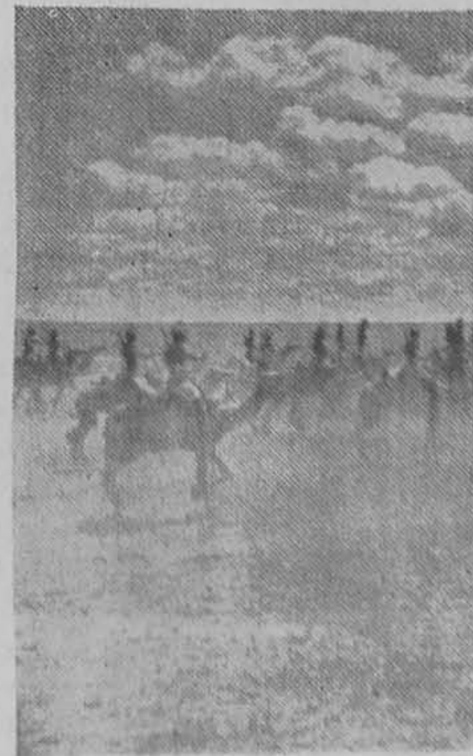
FRA BRITISK SOMALIL meler paa en af Sletterne i Somalia være en Ørken.

To Mænd af dens Besætning var blevet saaret og blev i Falcks Ambulance bragt til Fjerritslev Sygehus.