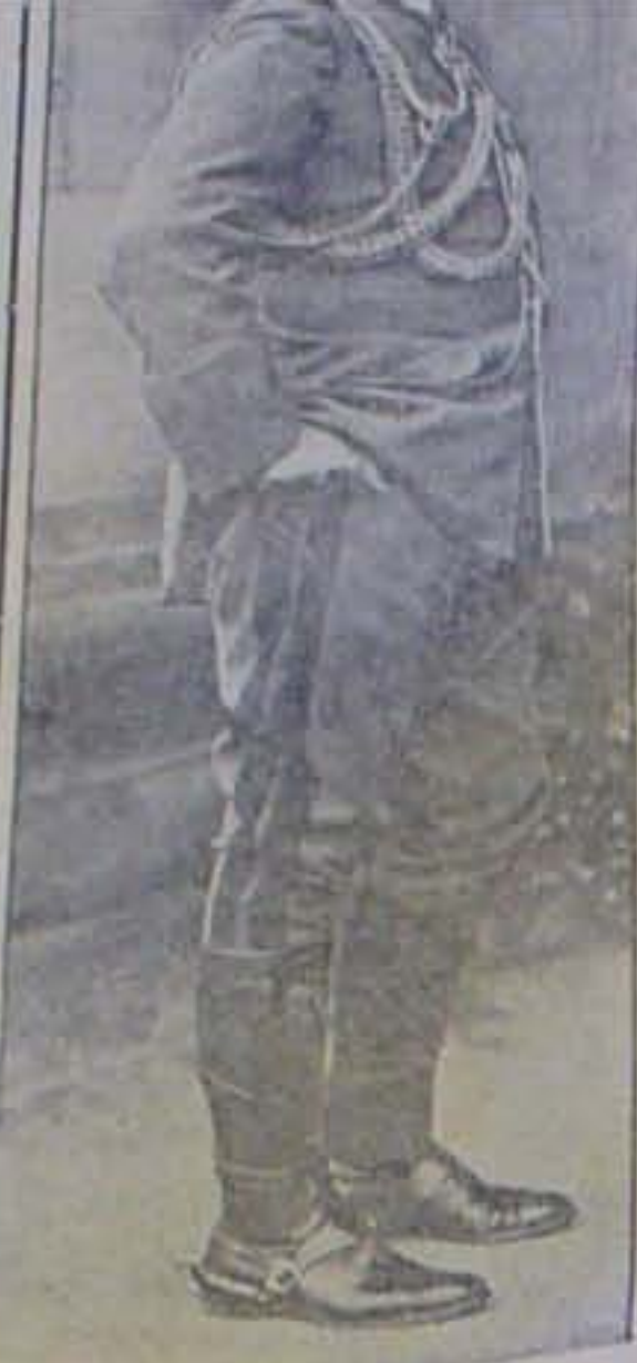
Ekskejseren fortograferet i 1918 kort før Flugten til Holland.

„B. T.“ meddeler fra Berlin: Efter foreliggende Meddelelser skal Ekskejser Wilhelm efter at de tyske Tropper havde besat Holland i nogen Tid have opholdt sig i Es- sen som Gæst hos Direktør Krupp von Bohlen. Det meddeles, at Eks- kejseren nu har taget Ophold paa et tysk Gods, hvor han bl. a. jæv- ligt modtager Besøg af Prins Auwi.