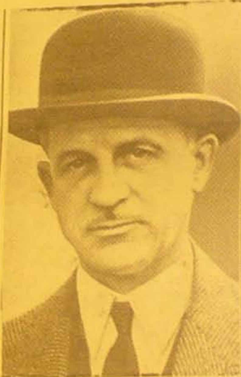
SUMNER WELLES, Fredsmægleren fra U. S. A.

En af de fremsatte Teorier gaar ud paa, at Sumner Welles overbeviste Mussolini om, at der ikke var noget Haab om at faa en Fredsplan, som den der skitseredes gennemført, og Mussolini arrangerede derefter Mødet med Hitler for at faa ham til at ændre Planen betydeligt.