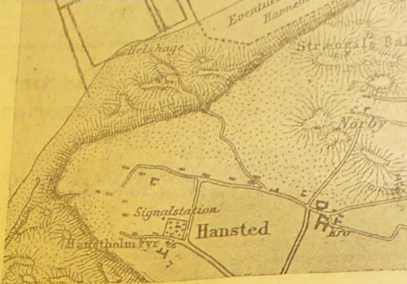
Plan over Havens Moler indtegnet paa et Generalstabskort over de til- grænsende Arealer, som de var, da Havens Bygning for 23 Aar siden blev vedtaget.

I de følgende Aar bevilgedes der mellem 300,000 og 400,000 Kr. indtil 1937, da der anvendtes 630,000 Kr., og de følgende tre Finansaar anvendtes smaa 600,000 Kr.