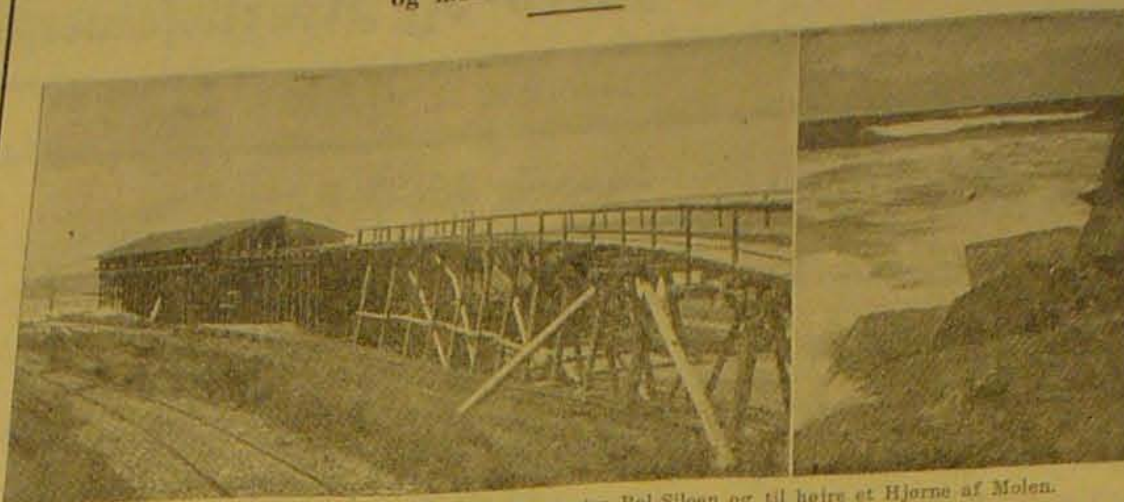
To Billeder fra Arbejdspladsen ved Molen, til venstre Ral-Siloen og til højre et Hjørne af Molen.

Som Svar til den konservative Finanslovsordfører udtalte Trafikministeren i Gaar, at han vil foreslaa Bevillinger til at gøre Havnen færdig paa den hurtigste og mest økonomiske Maade.