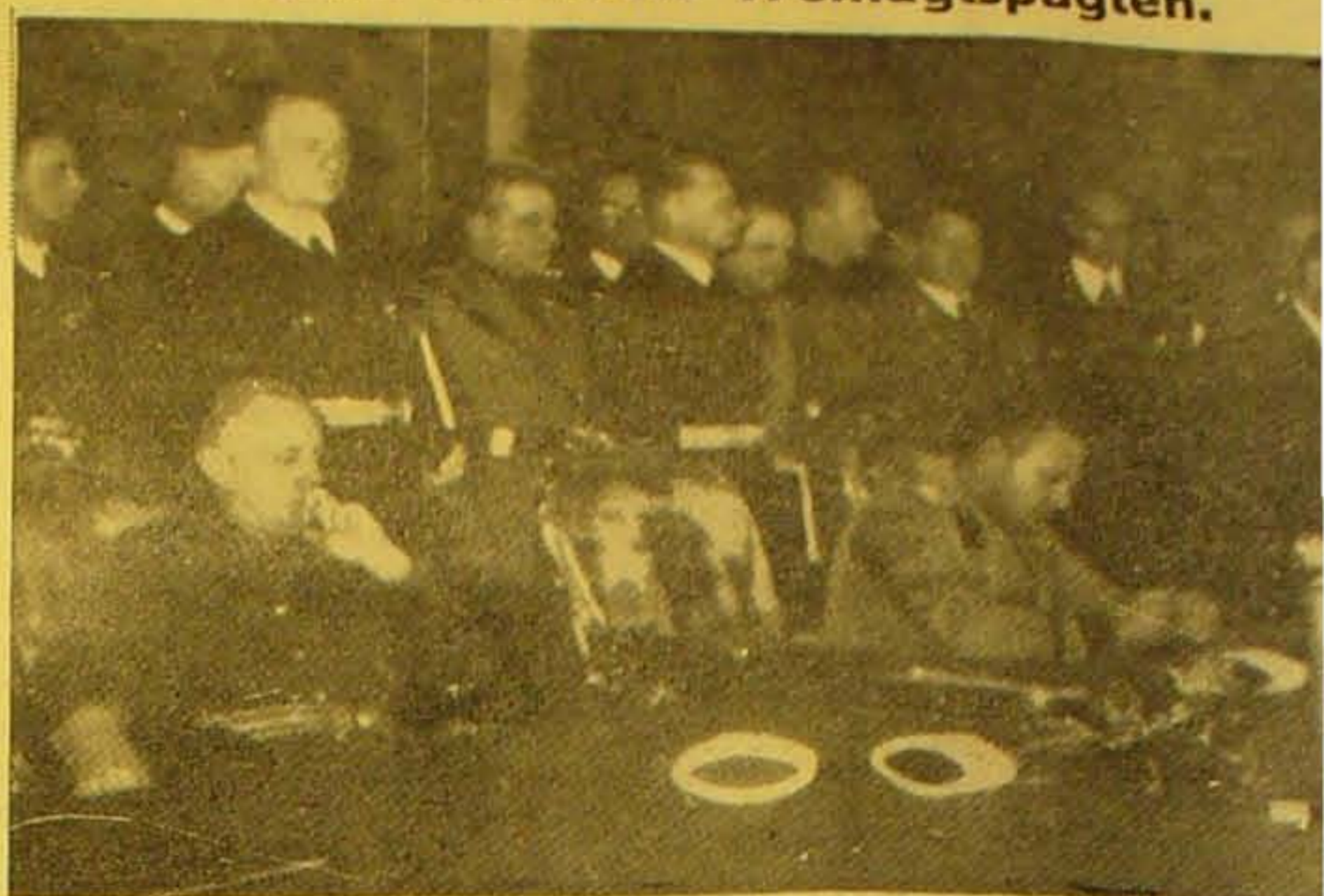
Et Billedtelegram af det historiske Øjeblik i Wien, da Ungarn tiltraadte Tremagtpagten. Fra venstre: Udenrigsminister von Ribbentrop, Udenrigsminister, Grev Ciano og (staaende yderst til højre) Grev Czaky, som undertegnede Protokollen paa Ungarns Vegne. Billedet er taget, da Underretningen var i Gange paa Belvedere Slottet.