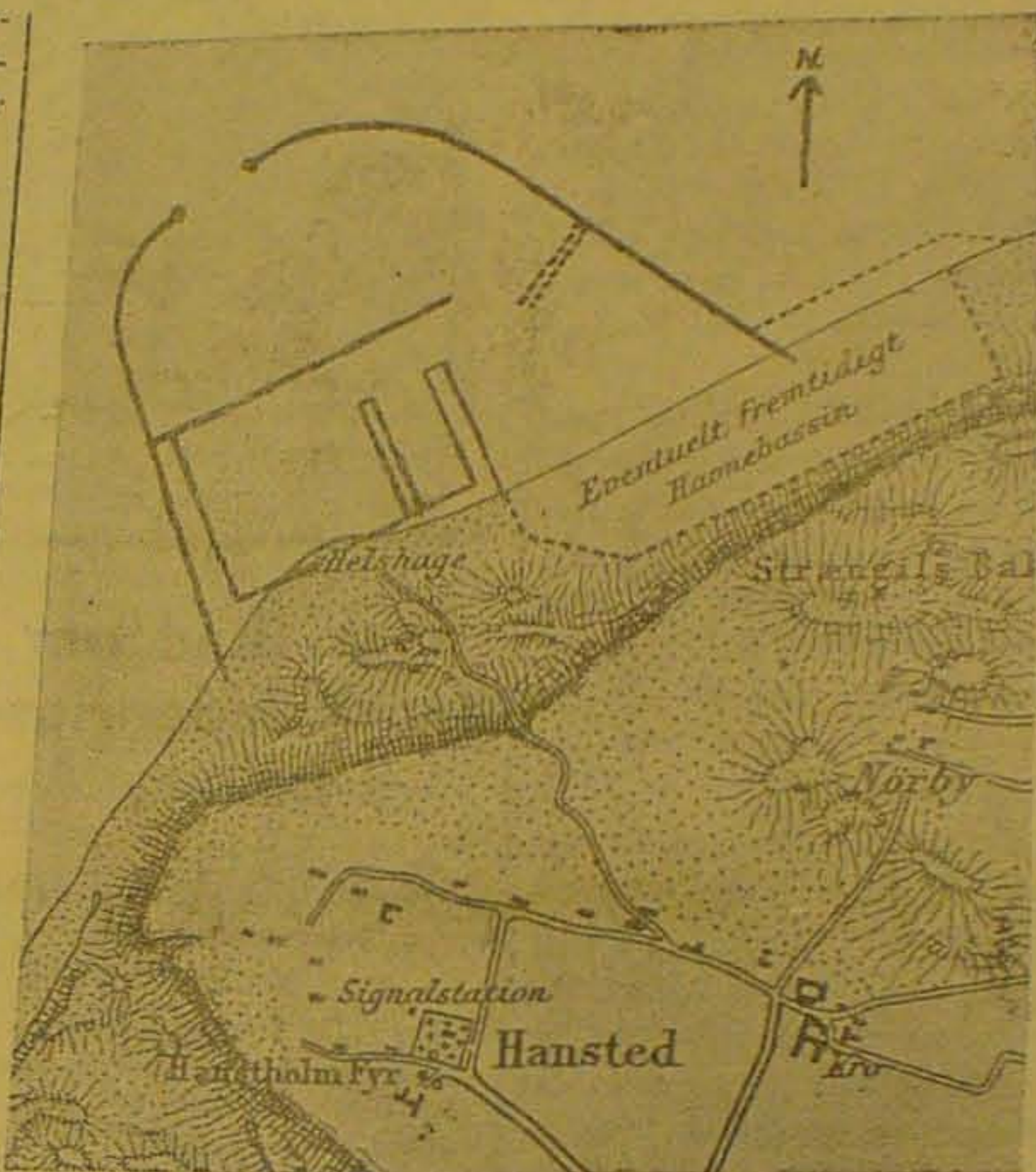
Plan over Havnens Moler indtegnet paa et Generalstabskort over de tilgrænsende Arealer, som de var, da Havnens Bygning for 23 Aar siden blev vedtaget.

Imidlertid kunde Ministeren ikke trænge igennem med sit Synspunkt, idet det daværende Finansudvalg med Udsættelse