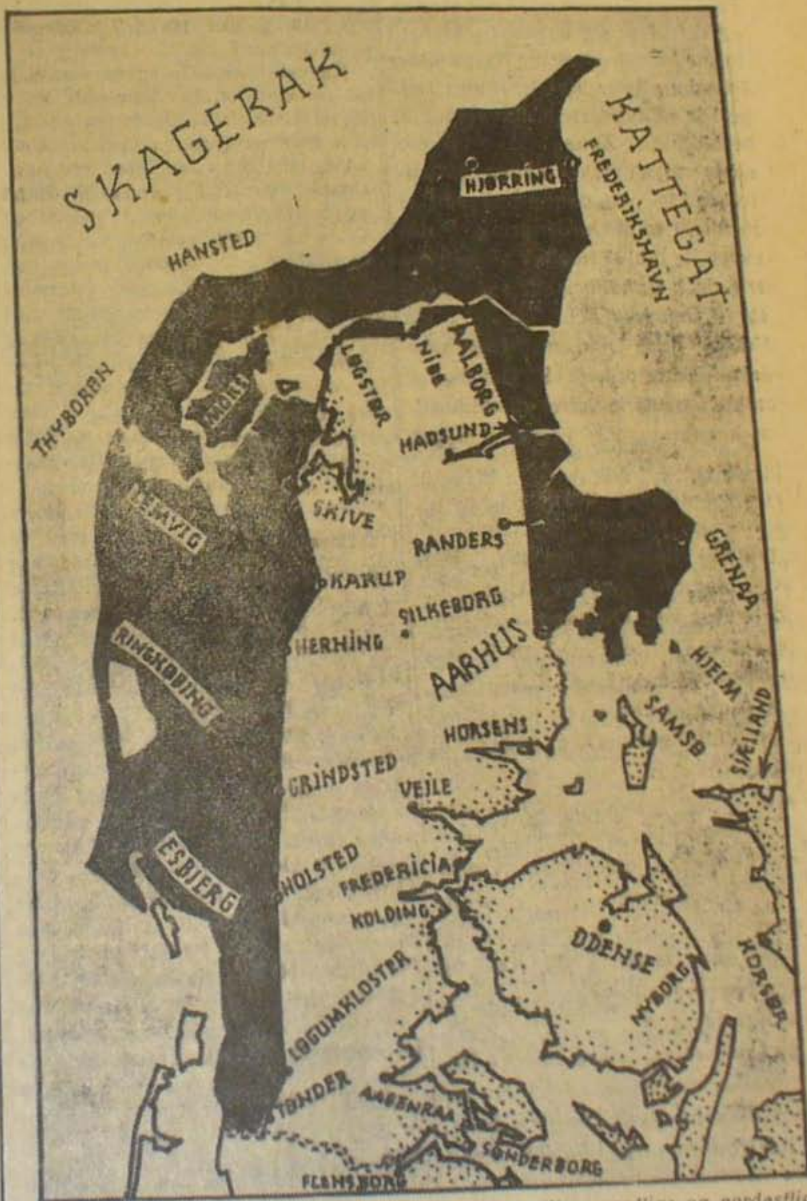
Det sorte Omraade angiver den Del af det vestlige, nordlige og nordøstlige Jylland, der kommer ind under Militar-Zonen.

l.) Ankara. præsident vil i tyske Ambassa- en samtale om ation, samtalen