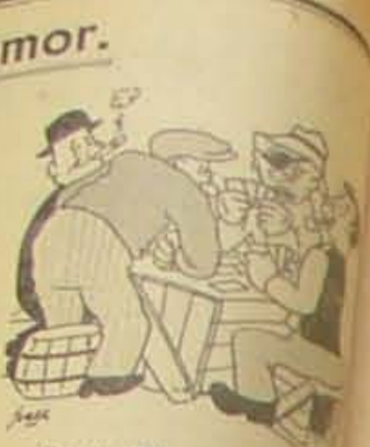
Der er en her, der smiler, der skal ikke have Narvik, der er det en Gaar til, han andet Sted ud ogsaa.