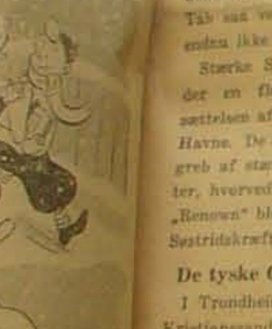
vi vil prøve paa at, spagt med sig, Karakteristisk.