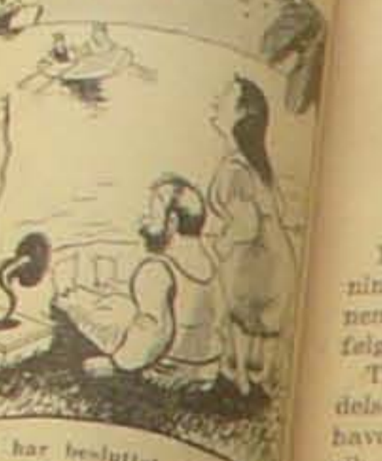
Vi har besluttet at vi skal, Vi har lige hørt de fra Europa i Radien.