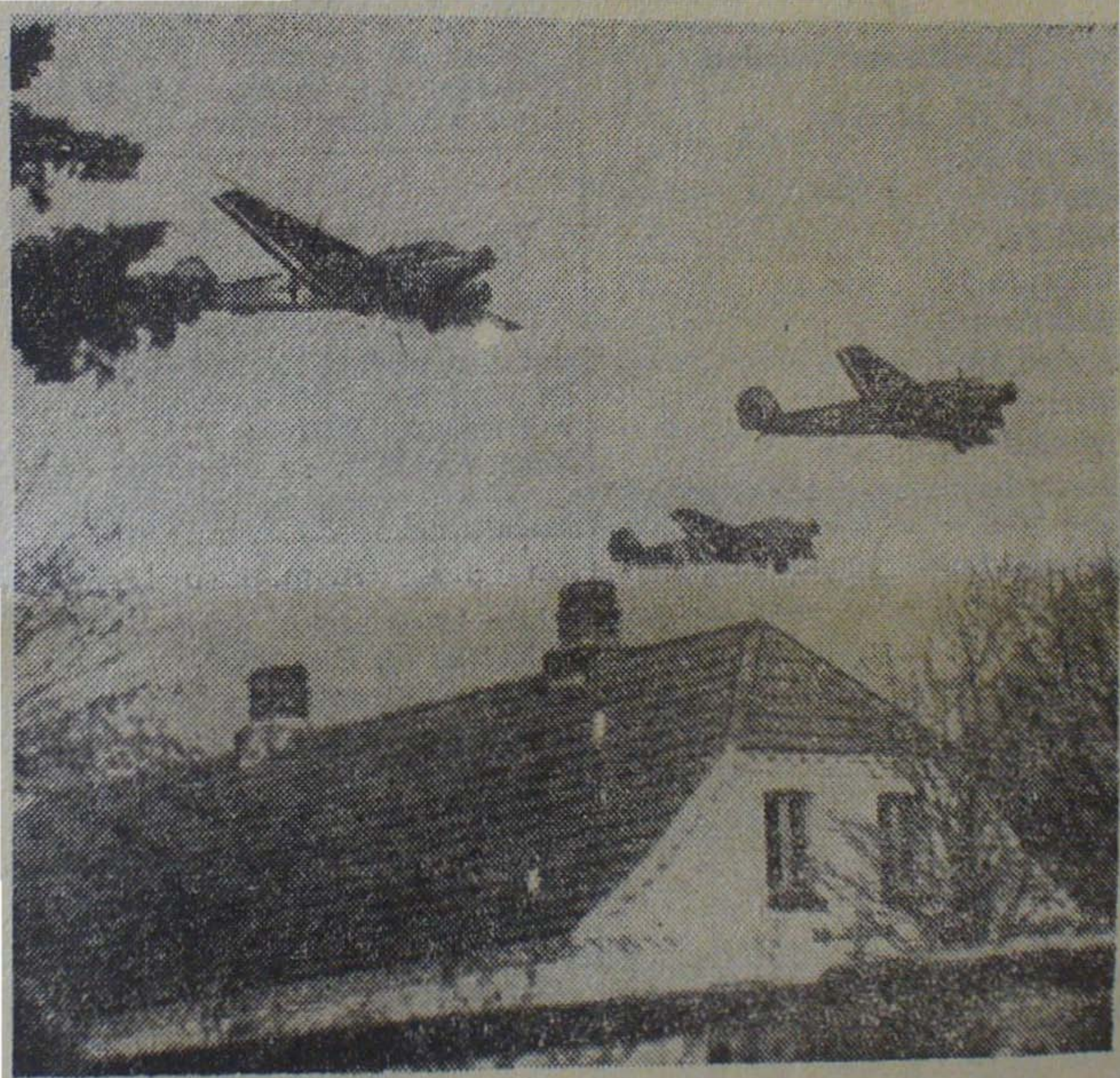
Tyske Flyvere drøner ind over Danmark 9. April.