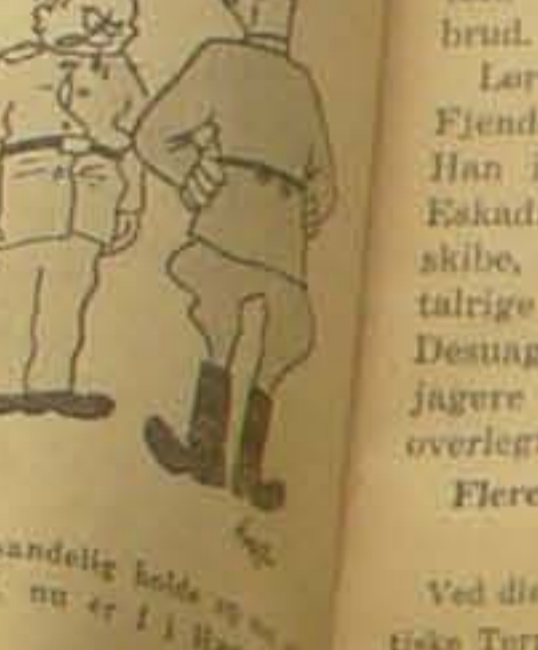
a sandelig lode, nu er i Jylland.