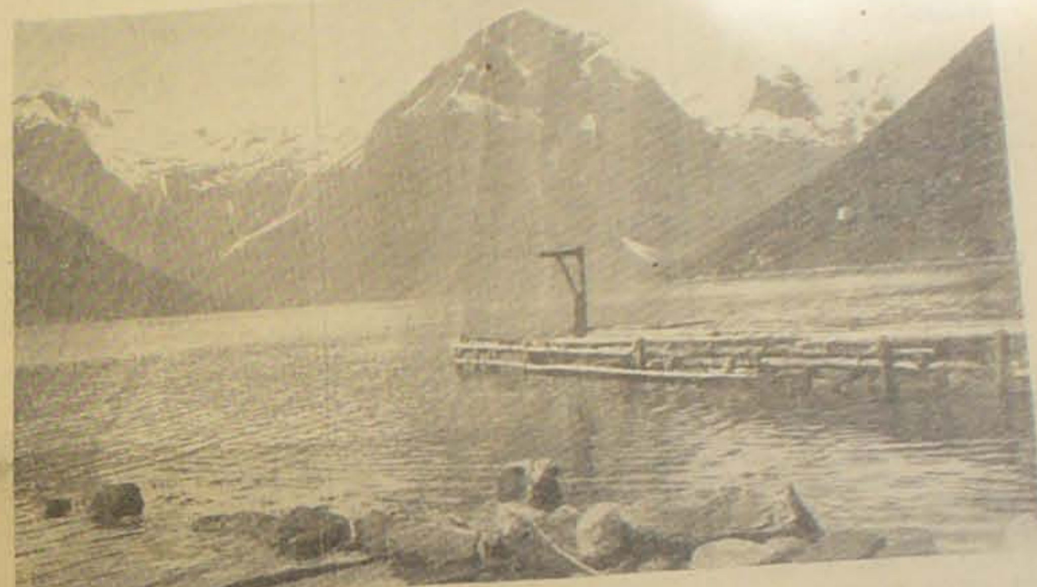
Et Billede fra Sognefjorden.

veret den overlegne Fjende haarde og bitre Kampe, hvormed de har opnaaet Verdens Beundring. Undervandsbaadsvaabnet og Flyvevaabnet har paa virksomt Maade understøttet Afværgelsen af det engelske