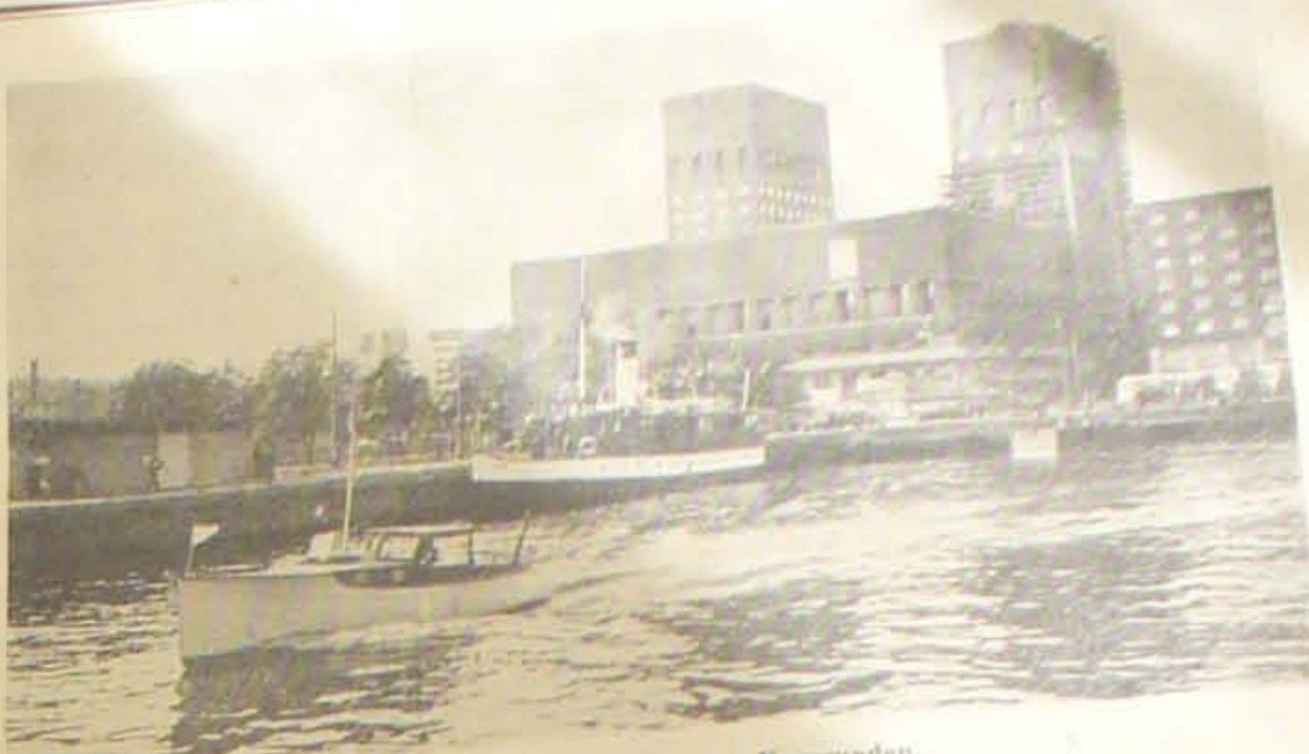
Oslo med Rådhuset i Forgrunden.