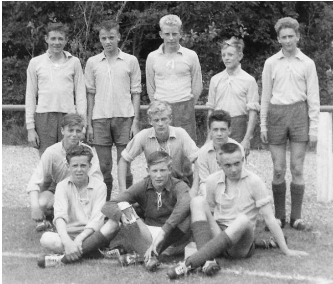
Her blev vi amtsmestre i 1962 – vi vandt 2-0 over Nors.

Faktisk fortsatte det meste af holdet helt til junior A, som dengang var det bedste man kunne nå i junior rækken. Jeg mener da at kunne huske, at vi bankede alle de store hold fra Randers, Viborg og Skive. Engang fik vi fri-spark mod Randers KFUM fordi en af deres spillere kom til at bande – jow, jow.