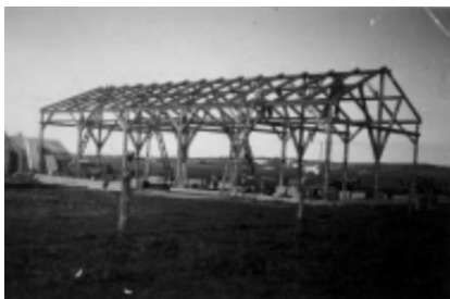
Senere tilbygning af staklade