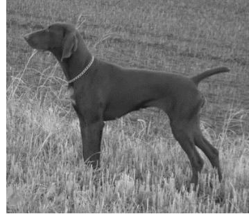
Min hund Dina

Da jeg var en lille dreng i 5-6 års alderen gik jeg og min bror på jagt med en gummi rækkebøsse og med bue og pil. Det var nok mest i fantasien, at jagten blev udøvet. En enkelt solsort og en allike har jeg skudt med bue og pil. Ellers skød vi mest til mål på opstillede skydeskiver. Startskuddet til en mangeårig interesse for jagt var affyret.