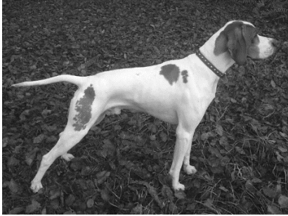
Min fars hund Prins