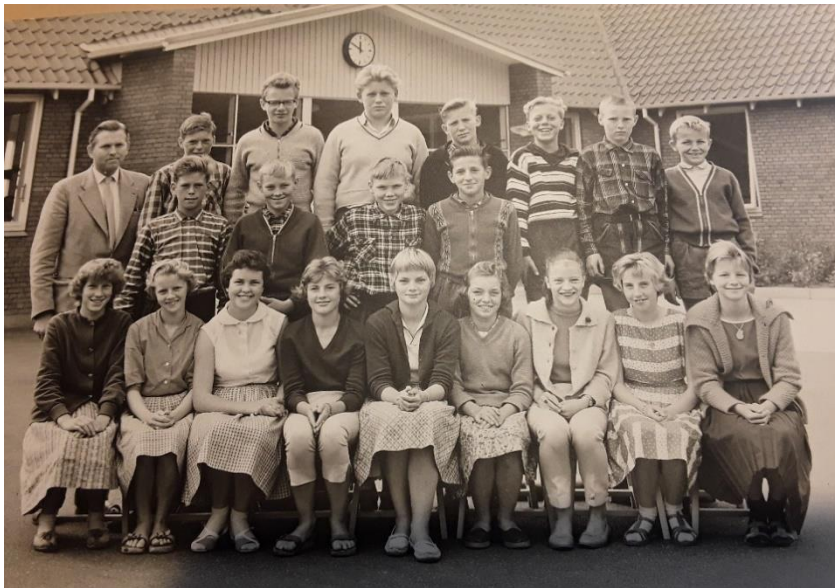
6.a Snedsted Centralskole 1959

8./9. klasse eller en treårig realafdeling. Der blev derfor bygget en ny skole i Snedsted, og alle elever fra de to skoler i Snedsted samt skolerne i Elsted og Årup begyndte i den nye skole den 1. august 1959, og de gamle skoler blev nedlagt. De ældste elever kom i 7. klasse, og jeg begyndte i 6. klasse.