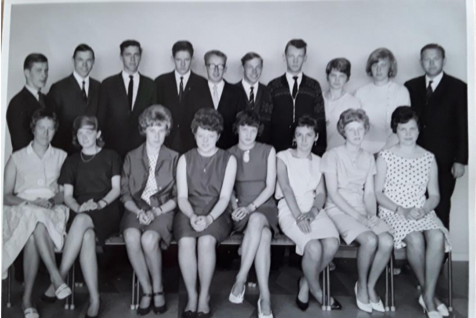
De første dimittender fra Snedsted Centralskole 1964