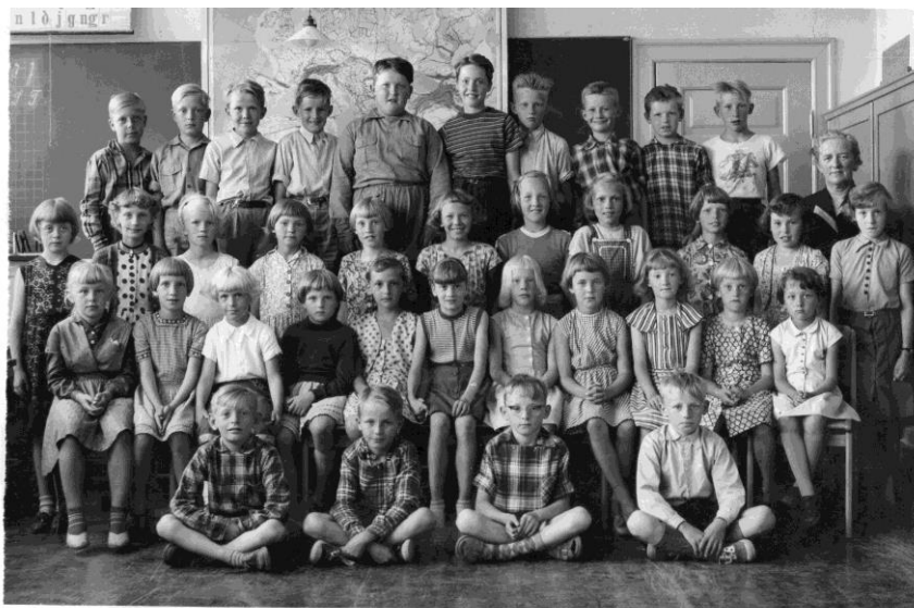
Tre årgange i samme klasse.