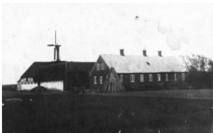
Før møllen brændte

Far døde, som tidligere nævnt i oktober 1970. Mor fortsatte arbejdet i idrætsforeningen nogle år endnu. Jeg tror, at arbejdet med de unge mennesker langt hen af vejen hjalp hende gennem sorgen efter fars død.