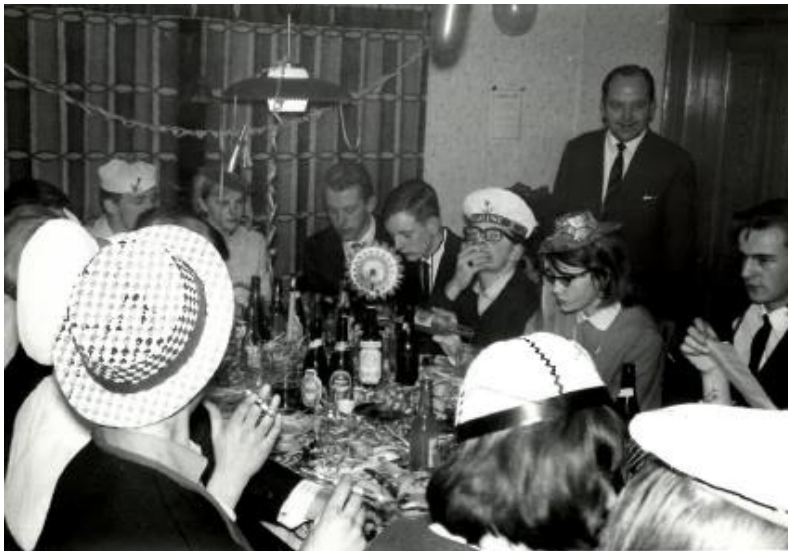
Her billede fra en fest i Gjersbøl. Min far serverer og nyder det.

Ægteskabet og hjemmet var særdeles harmonisk. Vi børn har aldrig hørt et skænderi eller lignende mellem vore forældre. Mine forældre var gavmilde, gæstfrie, selskabelige, behandlede de ansatte godt, havde mange hyggelige stunder med gode venner, og de var særdeles vellidt også blandt unge mennesker.