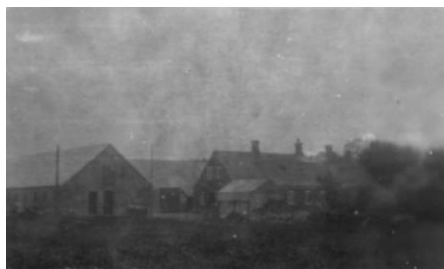
Gården efter at møllen var brændt