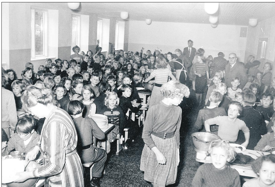
DER VAR trængsel omkring bordene og den varme mad på Borgerskolen. Børnebespisningen var i 1955 flyttet fra Asylgade til Skolegade.