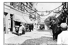
DEN ROYALE køretur med "automobiltoget" gennem Storgade blev forevigtet på et postkort.

Nu 101 år efter ser kongerøgelse ikke ud til at være aftagende. Af og til endda tværtimod. Det påstås, at ordene er blevet andre, men at det kun har noget med sprogets udvikling at gøre, for det er egentlig det samme, der bliver sagt og skrevet. De samme (onde) ånder tilføjer, at det jo kan komme an på en prøve, når Hendes Majestæt Dronning Margrethe og Prinsgemalen kommer på besøg i Thisted til september.