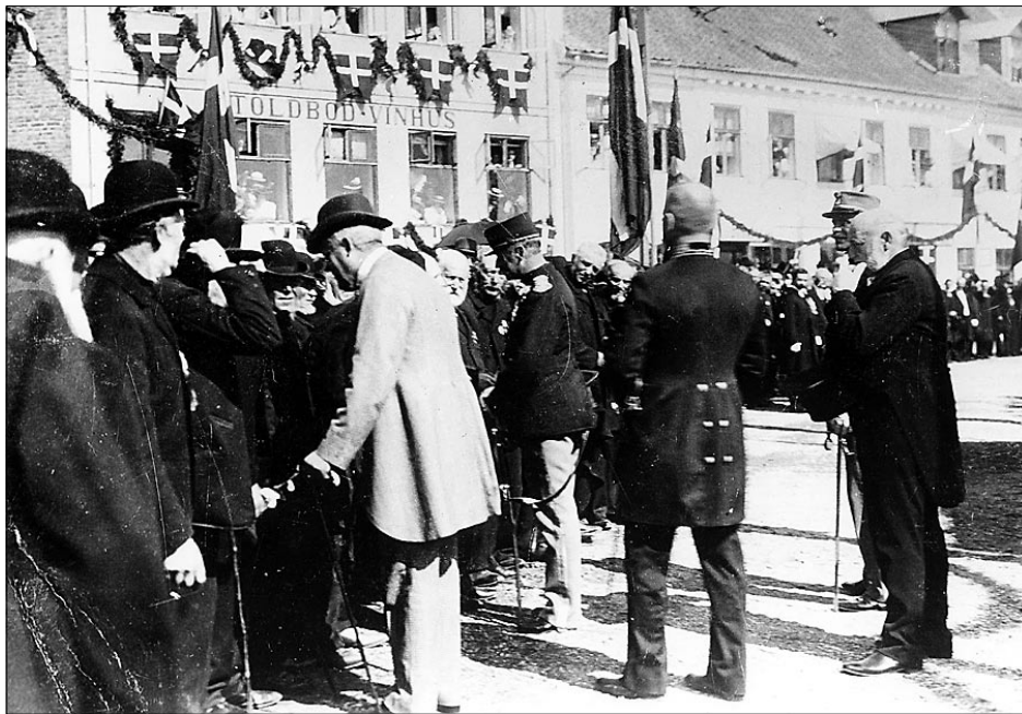
KONGEN HILSER på veteranerne fra 1864, der har taget opstilling på havnen foran toldboden.