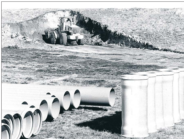
DEN SIDSTE etape af kloakplanen var arbejdet med rørføringen fra Taabel Renseanlæg til Høfde 93.